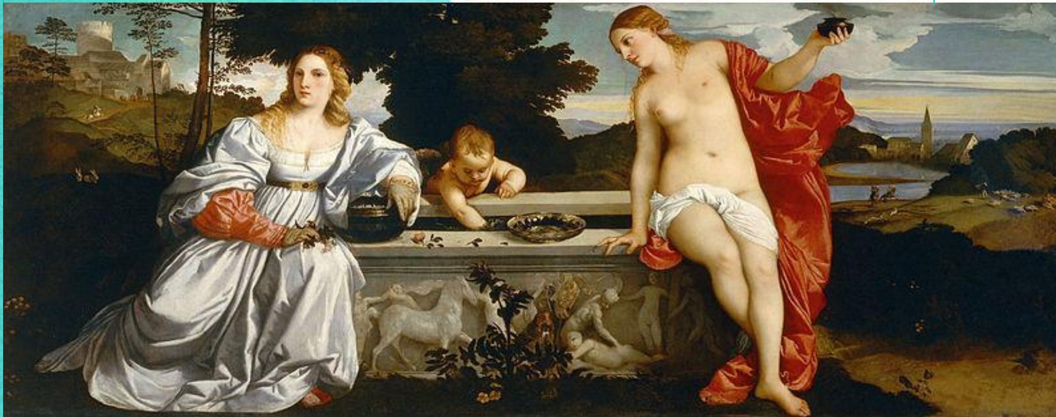
Любовь земная и Любовь небесная, 1514 Галерея Боргезе, Рим