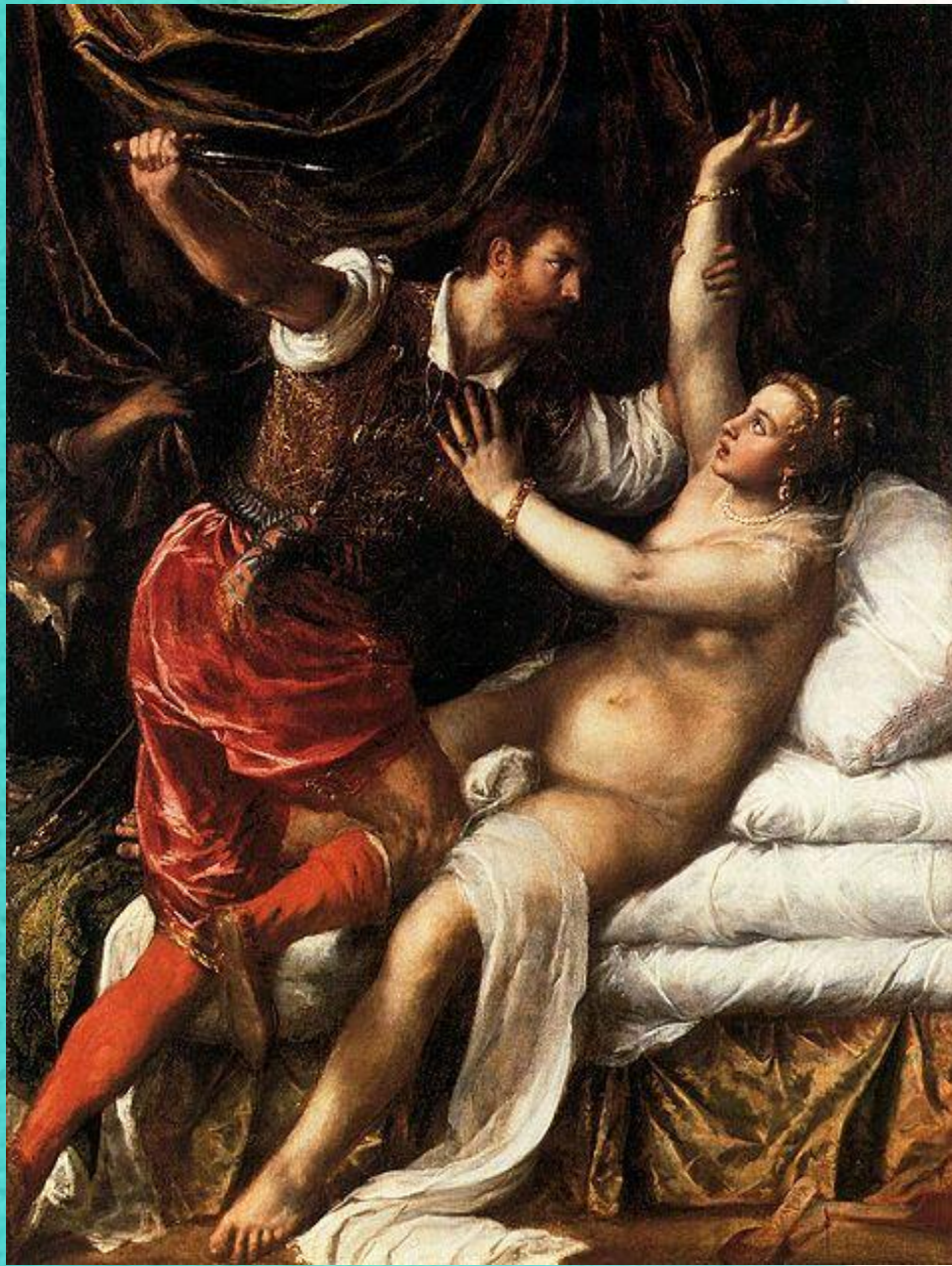
Тарквиний и Лукреция, 1569—1571 Музей Фицуильяма, Кембридж