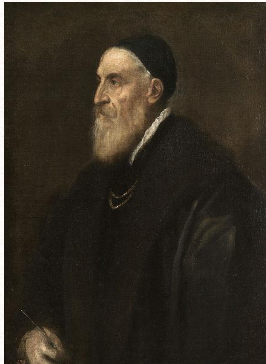
Автопортрет, около 1567 Музей Прадо, Мадрид

Тициа́н Вече́ллио — итальянский живописец эпохи Возрождения. Имя Тициана стоит в одном ряду с такими художниками Возрождения, как Микеланджело, Леонардо да Винчи и Рафаэль. Тициан писал картины на библейские и мифологические сюжеты, прославился он и как портретист. Ему делали заказы короли и римские папы, кардиналы, герцоги и князья. Тициану не было и тридцати лет, когда его признали лучшим живописцем Венеции.