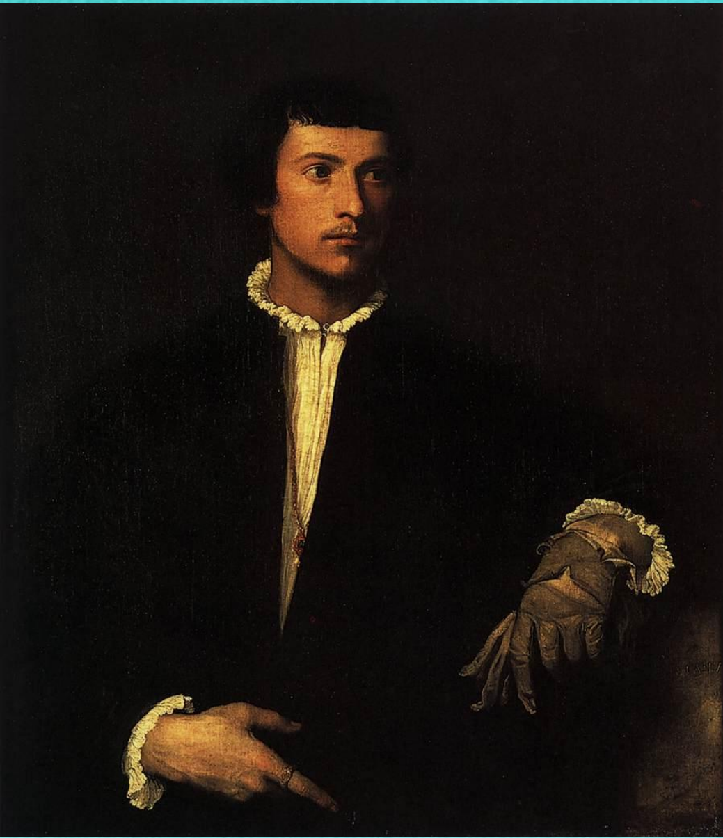
Мужчина с перчаткой, 1523