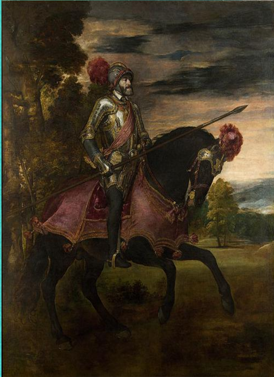
Конный портрет Карла V, 1548

Конец 1530-х—1540-е гг. — время расцвета портретного искусства Тициана. С удивительной прозорливостью изображал художник современников, запечатлевая самые различные, порой противоречивые черты их характеров: уверенность в себе, гордость и достоинство, подозрительность, лицемерие, лживость и т.д. Наряду с одиночными он создавал и групповые портреты, беспощадно вскрывая скрытую сущность взаимоотношений изображенных, драматизм ситуации. С редким искусством Тициан находил для каждого портрета наилучшее композиционное решение, выбирал характерные для модели позу, выражение лица, движение, жест.