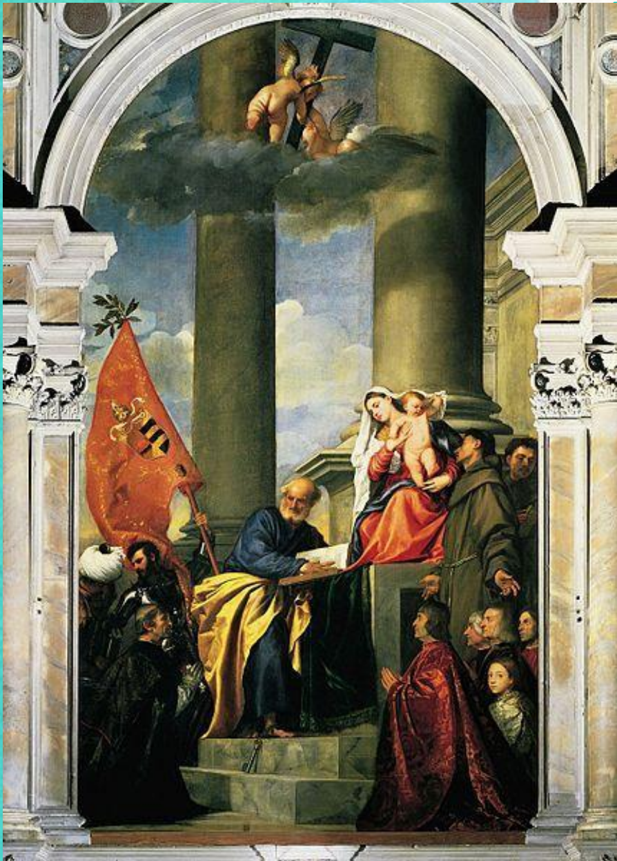
Мадонна Пезаро, 1526