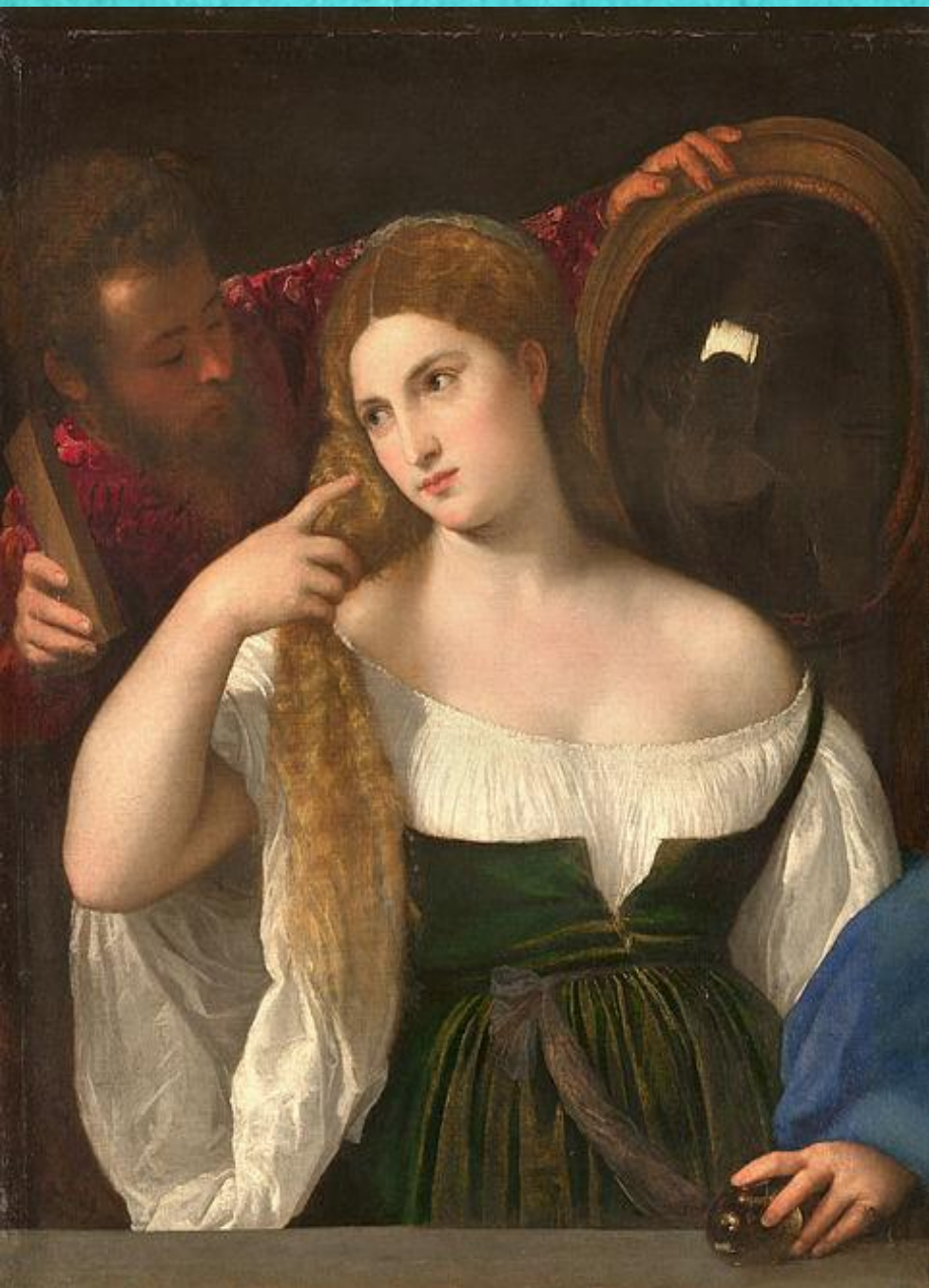
Женщина перед зеркалом, 1515 Лувр, Париж