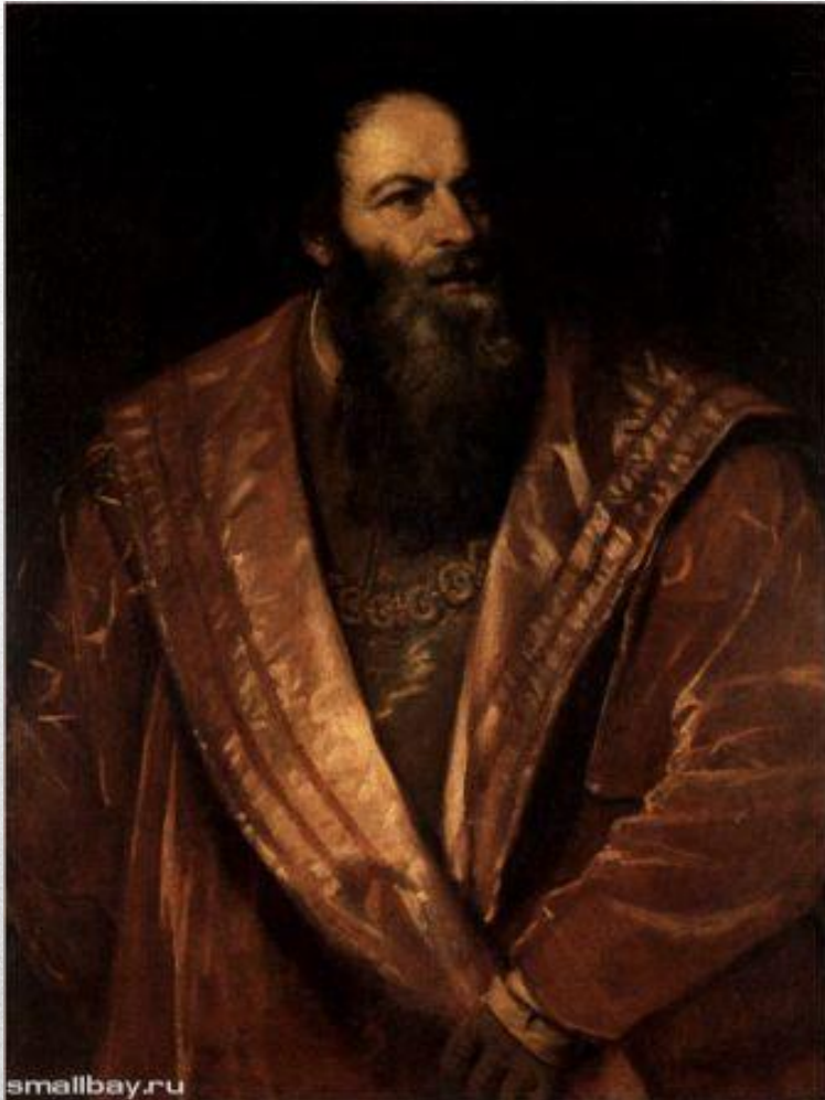
Пьетро Аретино (1545)