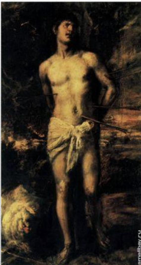
«Святой Себастьян», 1565-1570, Эрмитаж