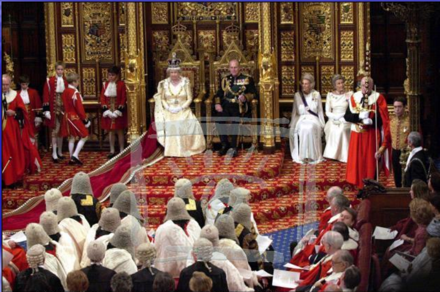
No:462053.01 Date:14.11.2002 Headline:LONDON : THE STATE OPENING OF PARLIAMENT... Caption: THE QUEEN SPEECH AT THE STATE OPENING OF PARLIAMENT...