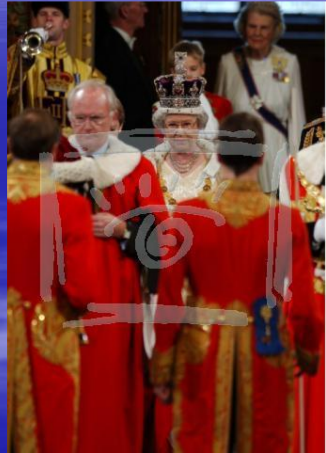
Ее Высочество королева английская Елизавета II на церемонии во всех регалиях прохадит по королевской галерее во время церемонии открытия британской парламента 13 ноября 2002. Церемония открывает парламентарский год Великобритании. ПП

Королева Елизавета II произносит речь на открытии английского парламента, Вестминстер, Лондон, Великобритания, 13 ноября 2002.