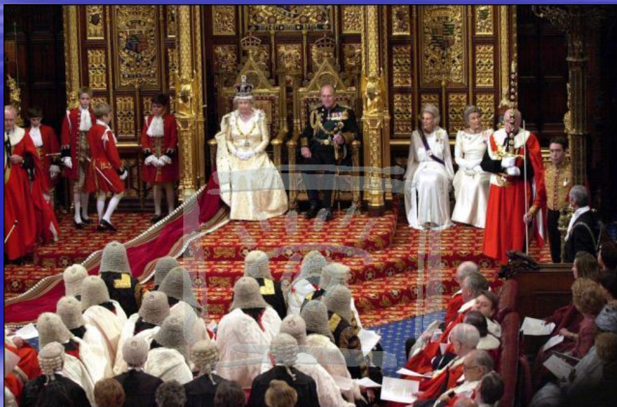
No:462053.01 Date:14.11.2002 Headline:LONDON : THE STATE OPENING OF PARLIAMENT... Caption: THE QUEEN SPEECH AT THE STATE OPENING OF PARLIAMENT...