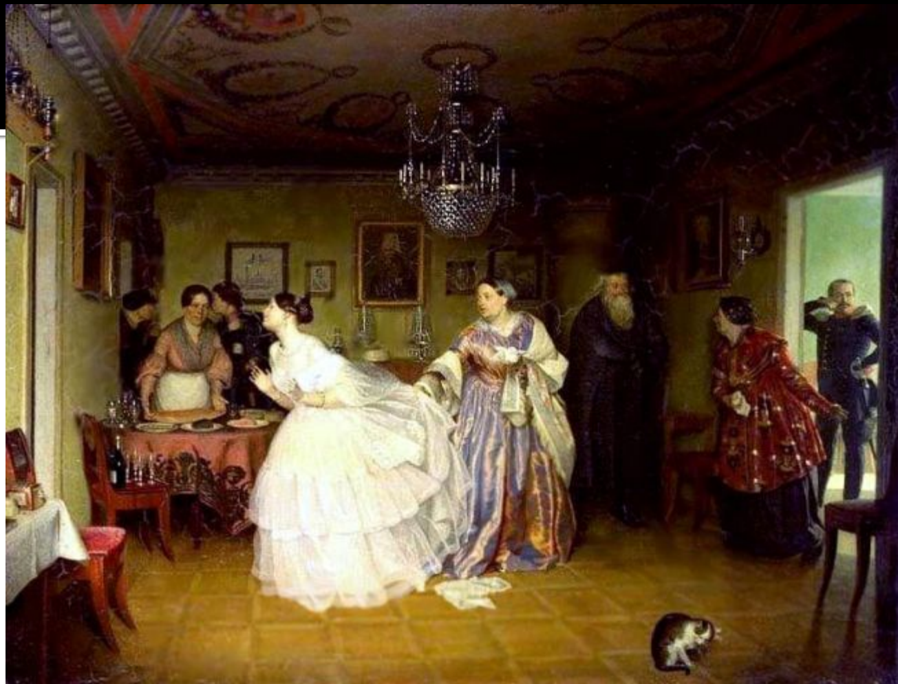
П.Фёдоров. СВАТОВСТВО МАЙОРА.