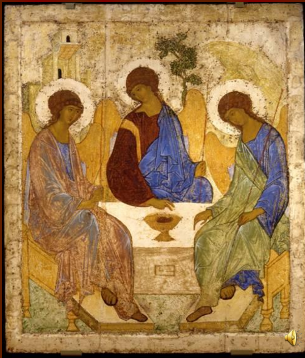
Андрей Рублев. Троица ветхозаветная