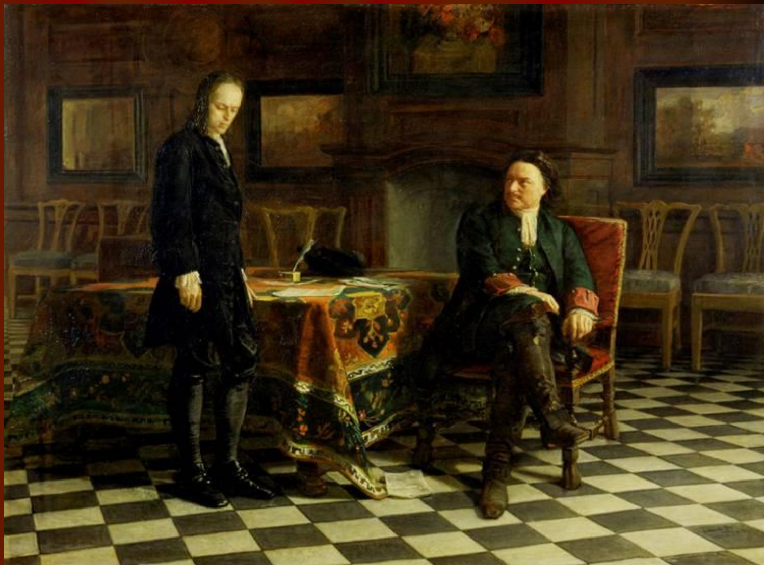
Н.Н.Ге. Пётр I допрашивает царевича Алексея Петровича в Петергофе.