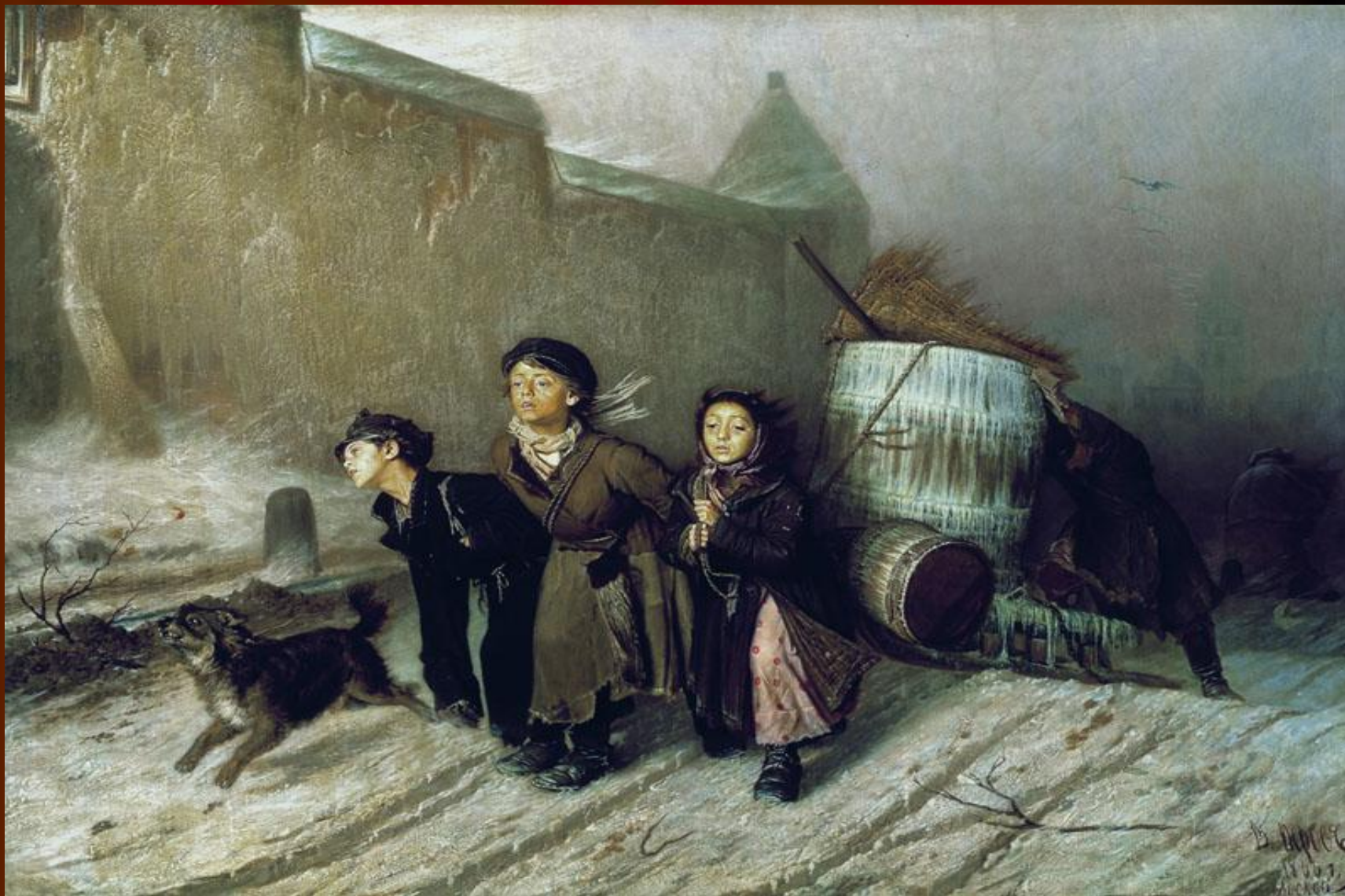
В.Г.Перов. «Тройка». Ученики — мастера везут воду.