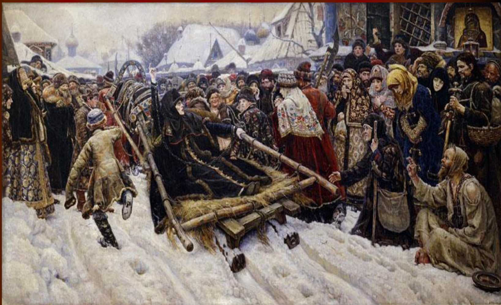
В.И.Суриков. Боярыня Морозова