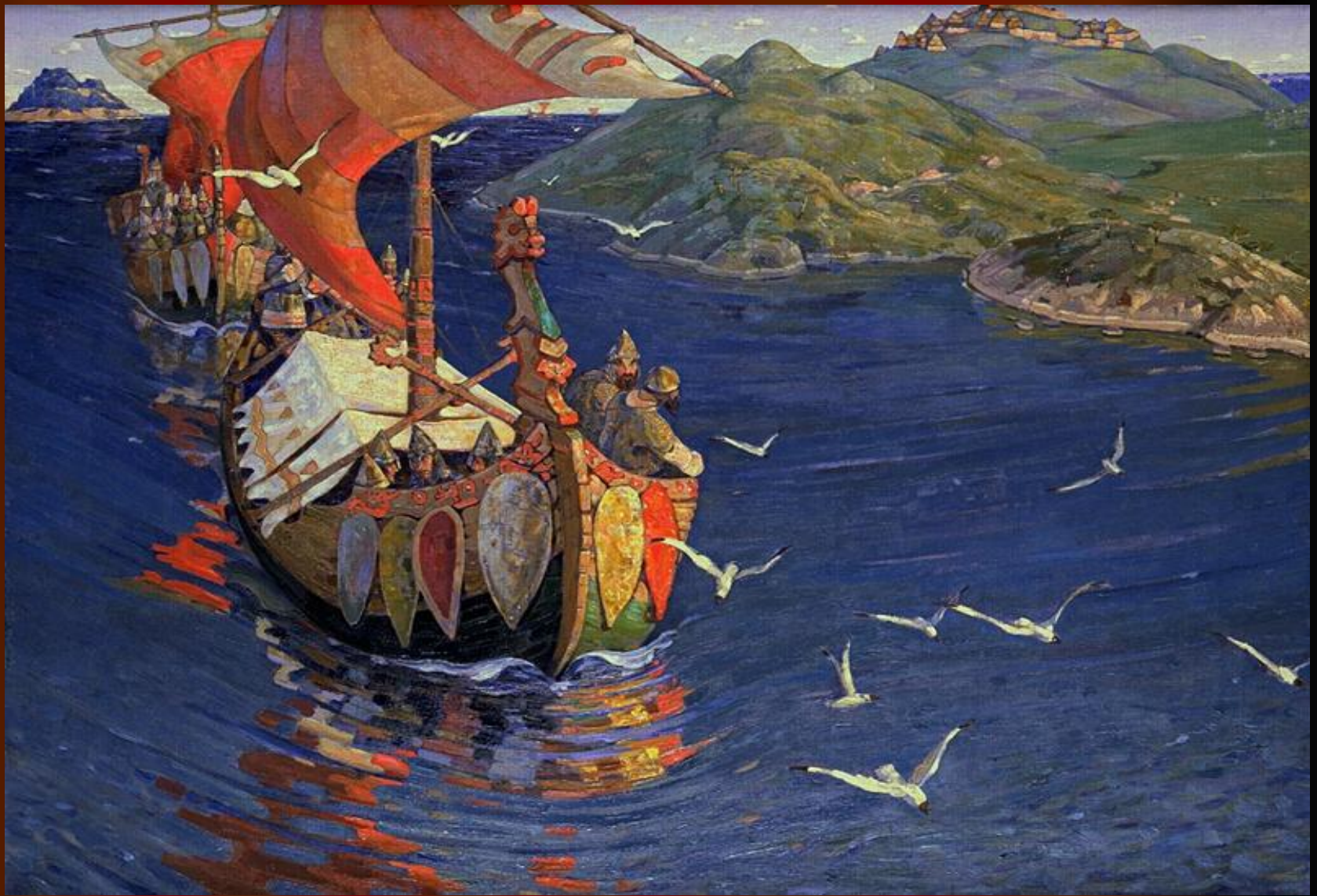
Н.К.Рерих. Заморские гости