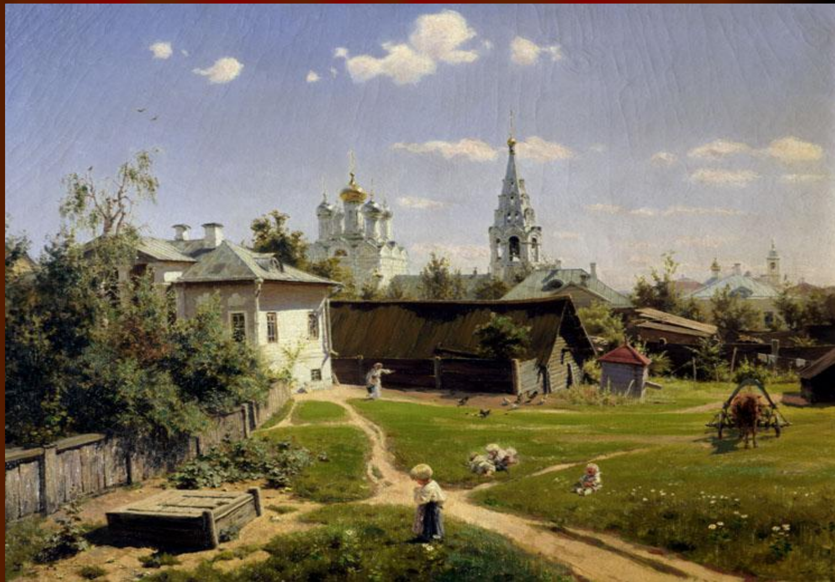
В.Д.Поленов. Московский дворик