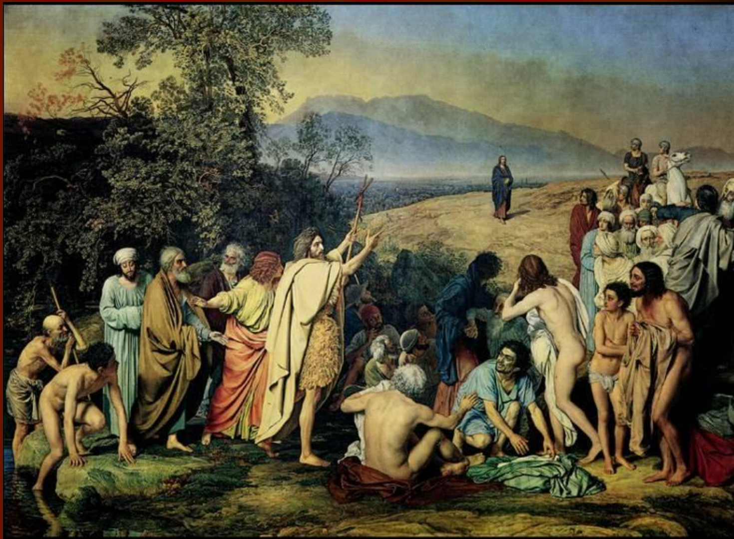
А.А.Иванов. Явление Христа народу