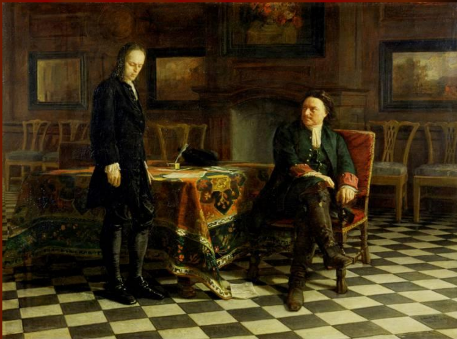
Н.Н.Ге. Пётр I допрашивает царевича Алексея Петровича в Петергофе.