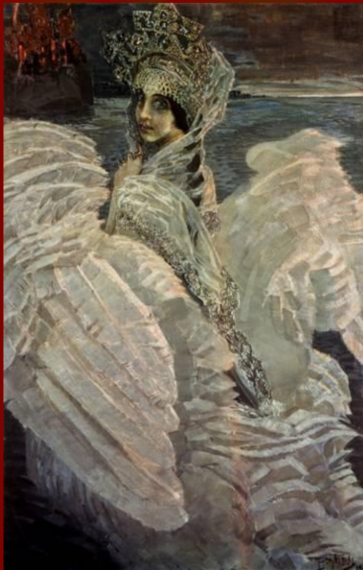
М.А. Врубель. Царевна-Лебедь