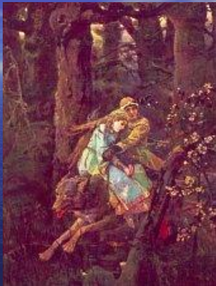
«Иван Царевич на Сером Волке»