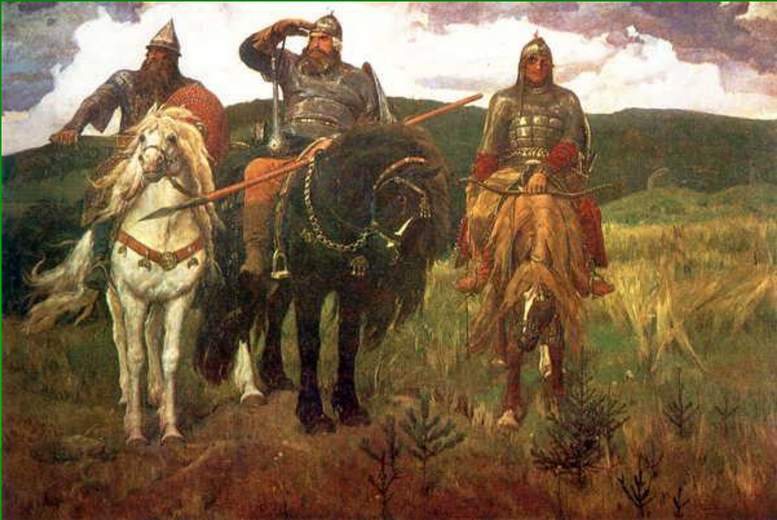
Виктор Васнецов. Богатыри. 1881-1898г. Государственная Третьяковская галерея.