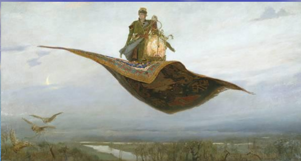
«Ковер – самолет» 1880г.