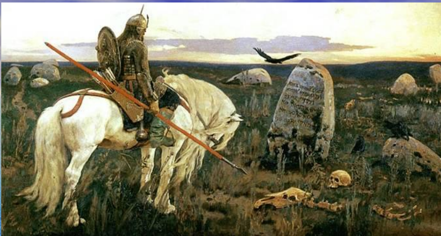
«Витязь на распутье» 1882г.