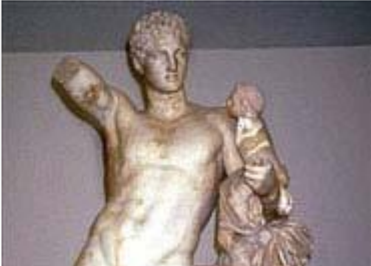
Пракситель. Гермес с младенцем Дионисом. Середина 4 в. до н.э.