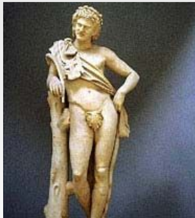
Пракситель. Отдыхающий Сатир. Около 340-330 гг. до н.э. Капитолийские музеи, Рим.