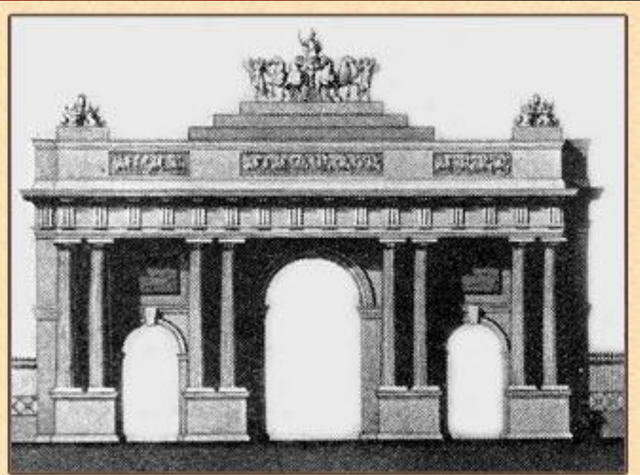
МОСКОВСКИЕ ТРИУМФАЛЬНЫЕ ВОРОТА. ПРОЕКТ А.К.КАВОСА

Над проектом триумфального ансамбля «Площади победы» вначале работал архитектор А.К.Кавос. Ансамбль должен был включить несколько монументов, посвященных победе в русско-турецкой войне 1828-1829 годов (obelisks, пирамиды, колоннаду, трехпролетную арку). Воплощение столь сложного проекта потребовало бы огромных материальных и временных затрат. Проект триумфальных ворот на Московской заставе предложили исполнить Стасову, который к тому времени успешно завершил работу над Нарвскими триумфальными воротами.