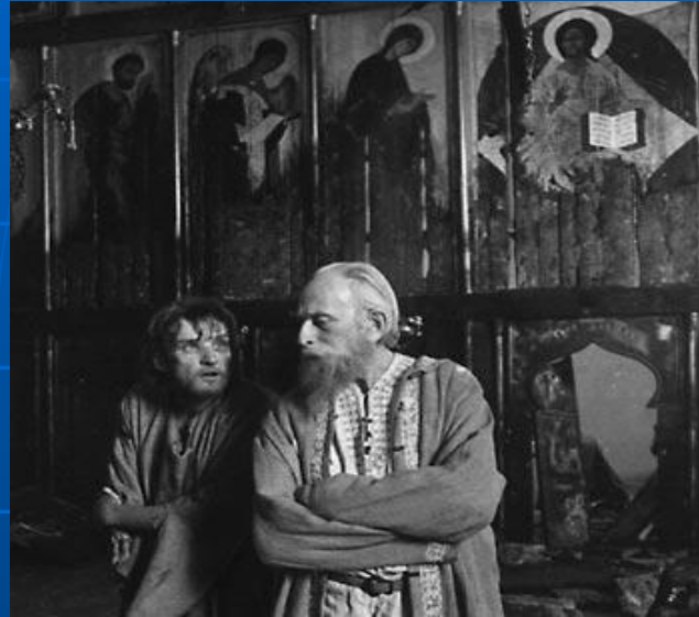
Церковь Святой Троицы в Троице-Сергиевой лавре