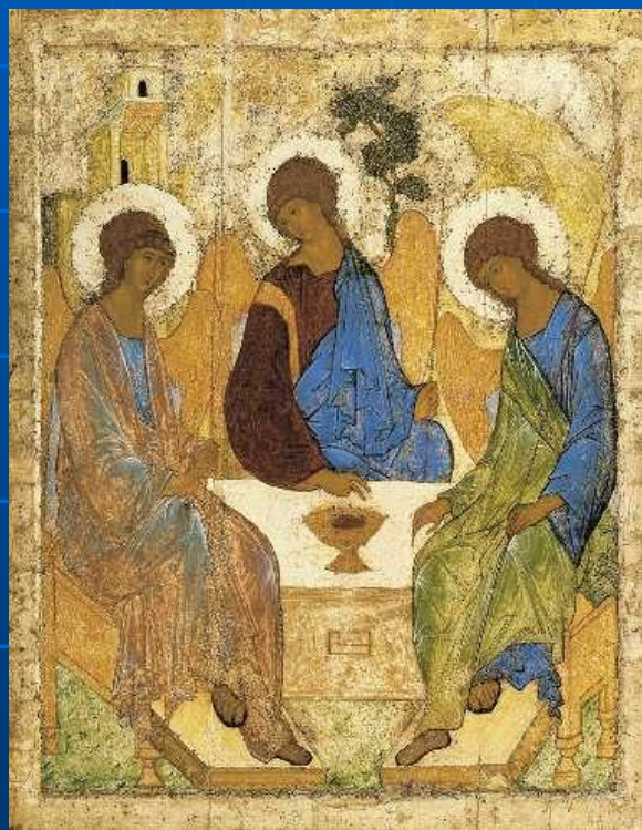
«Троица» А.Рублева 15 в.