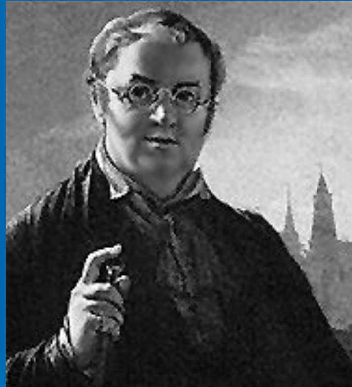
В. А. Тропинин. «Автопортрет». Около 1824.

ТРОПИНИН Василий Андреевич (1776–1857), русский живописец. В портретах стремился к живой, непринужденной характеристике человека (портрет сына, 1818; «А. С. Пушкин», 1827; автопортрет, 1846), создал тип жанрового, несколько идеализированного изображения человека из