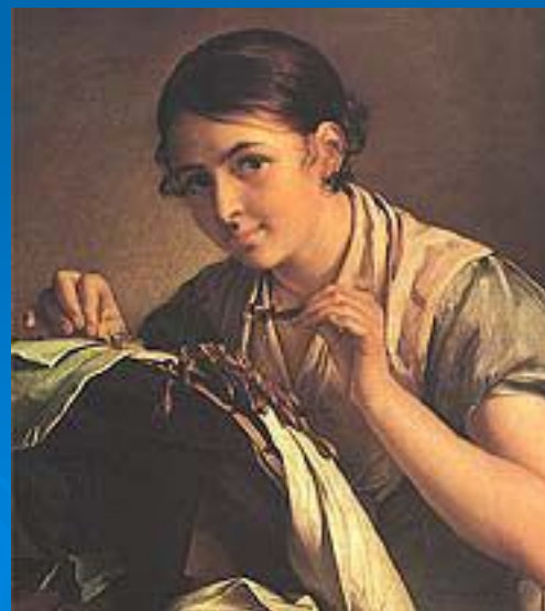
В. А. Тропинин. «Кружевница». 1823 год. Третьяковская галерея.

В портретах 1830-40-х годов возрастает роль выразительной детали, в ряде случаев — пейзажного фона, усложняется композиция, напряженной и экспрессивней становится колорит. Романтическая атмосфера, стихия творчества, предстает еще более наглядной в портрете «К. П. Брюллова» (1836, Третьяковская галерея) и автопортрете 1846 года (там же), где художник представил себя на эффектном историческом фоне Московского Кремля. При этом романтизм художника, не возносясь в эмпиреи, обычно остается камерным и умиротворенно-«домашним» — даже там, где очевиден намек на сильное чувство, эротический мотив («Женщина в окне», чей образ был навеян поэмой М. Ю. Лермонтова «Тамбовская казначейша», 1841, там же). Поздние произведения Тропинина (например, «Слуга со штофом, считающий деньги», 1850-е гг., там же) свидетельствуют об угасании колористического мастерства, однако по-прежнему привлекают своей жанровой наблюдательностью, предвосхищающей страстный интерес к бытописанию, свойственный русской живописи 1860-х гг..