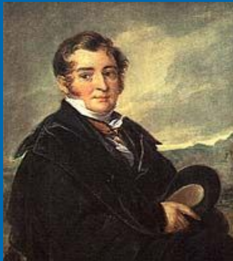
В. А. Тропинин. «Портрет неизвестного из семьи Голицыных». Этюд, 1820-е годы.