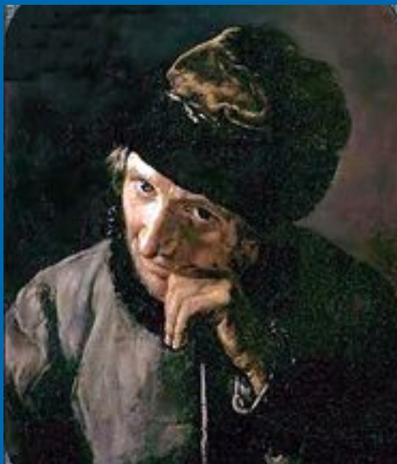
В.А. Тропинин. Ящик, опирающийся на кнутовище. 1820-е годы.