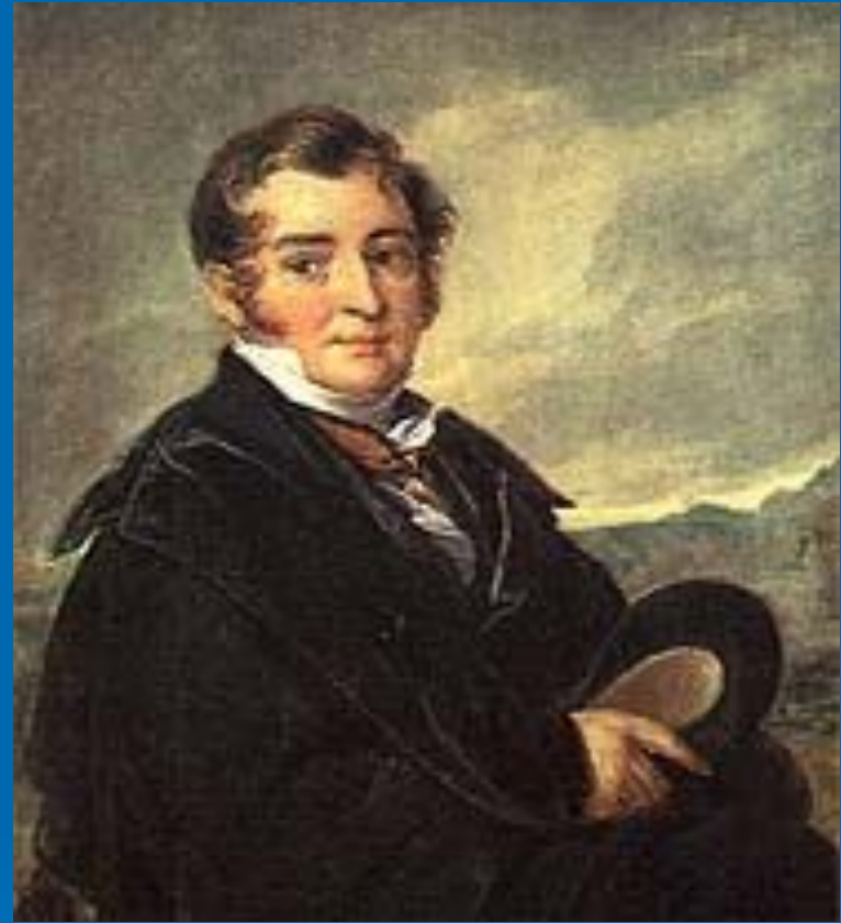
В. А. Тропинин. «Портрет неизвестного из семьи Голицыных». Этюд, 1820-е годы.