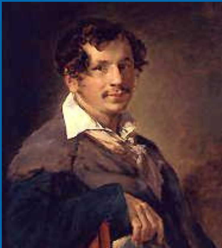
В. А. Тропинин. «Портрет Булахова». 1823. Третьяковская галерея.