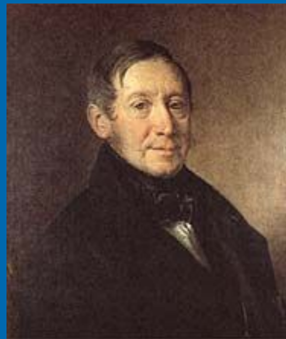
Архитектор К. А. Тон. Портрет работы В. А. Тропинина.