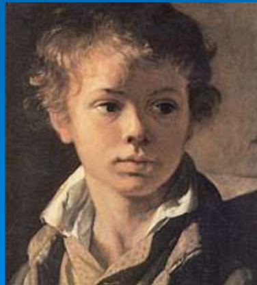
«Портрет А. В. Тропинина» (сына художника). Около 1818 года. Третьяковская галерея.

ТРОПИНИН Василий Андреевич [19 (30) марта 1776, с. Карповка Новгородской губернии — 4 (16) мая 1857, Москва], русский художник. Один из основоположников романтизма в живописи России. Родился в семье крепостных. Был крепостным сначала графа А. С. Миниха, затем И. И. Моркова. В 1798-1804 учился в петербургской Академии художеств, где сблизился с О. А. Кипренским и А. Г. Варнеком (последний тоже стал впоследствии видным мастером русского романтизма). В 1804 Морков вызвал молодого художника к себе; затем тот попеременно жил то на Украине, в селе Кукавка, то в Москве, на положении крепостного живописца, обязанного одновременно выполнять хозяйственные поручения помещика. Лишь в 1823 был окончательно освобожден от крепостной зависимости. Получил звание академика, но, отказавшись от карьеры в Петербурге, в 1824 поселился в Москве.