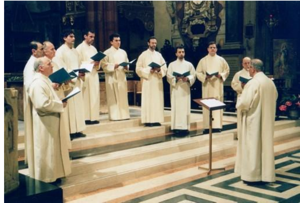
Мужской григорианский хор

С распадом Римской империи (395) произошло разделение церкви на зап. католическую и вост. православную, различающиеся ритуалом и муз. оформлением культа. Католич. папская церковь скоро распространила влияние почти на всю Зап. Европу. Возник ряд местных центров католицизма со своими вариантами литургии: кроме римской и миланской (амвросианской) - староиспанская (мозарабская), старофранцузская (галликанская), кельтская (британо-ирландская). Но постепенно все региональные традиции (кроме миланской) были вытеснены официальным римским хоралом, названным в честь папы Григория Великого (ок. 540-604) григорианским (см. Григорианское пение ). Важный этап в эволюции григорианского хорала связан с именами папы Виталия (657-72) и аббатов собора св. Петра Котоленуса, Мариануса и Вирбонуса (между 653 и 680). Окончательно свод григорианских песнопений сложился к кон. 9 в. Отрывки из Ветхого и Нового заветов читались нараспев в виде литургич. речитатива. Псалмы исполнялись в более распевной, чем ранее. Мелодич. основу чтений и псалмов составляли особые формулы-попевки (initium, mediatio, punctum), строго классифицированные в соответствии со ср.-век. системой 8 церк. ладов (модусов, или тонов; см. Средневековые лады ): для чтений предназначались т. н. Lektionstöne (нем.), для псалмов - Psalmtöne , для молитв - Orationstöne и т. д. Кроме чтений и псалмов, в григорианский обиход входили антифоны, респонсории, гимны, кантики.