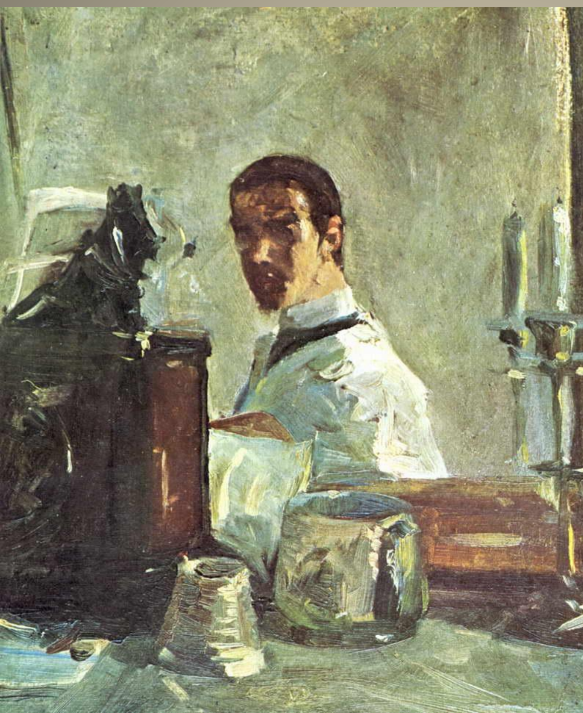
«Автопортрет перед зеркалом»