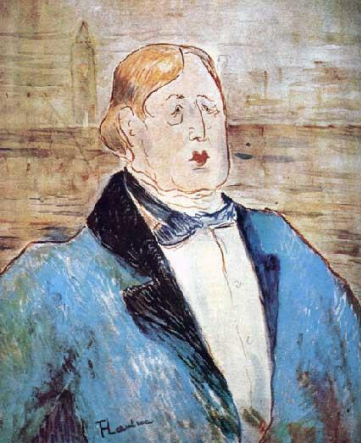
«Портрет Оскара Уайльда»