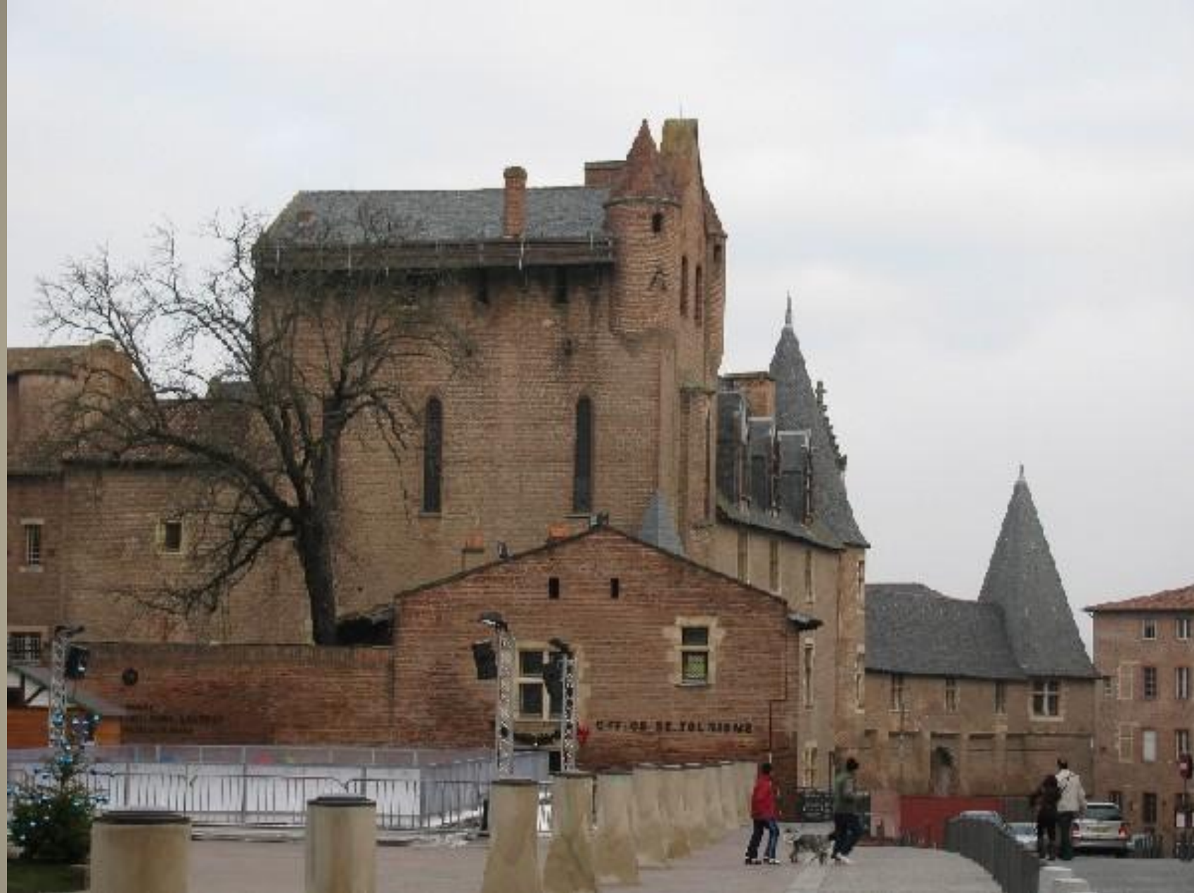
Альби. Замок Берби (Музей Тулуза-Лотрека)