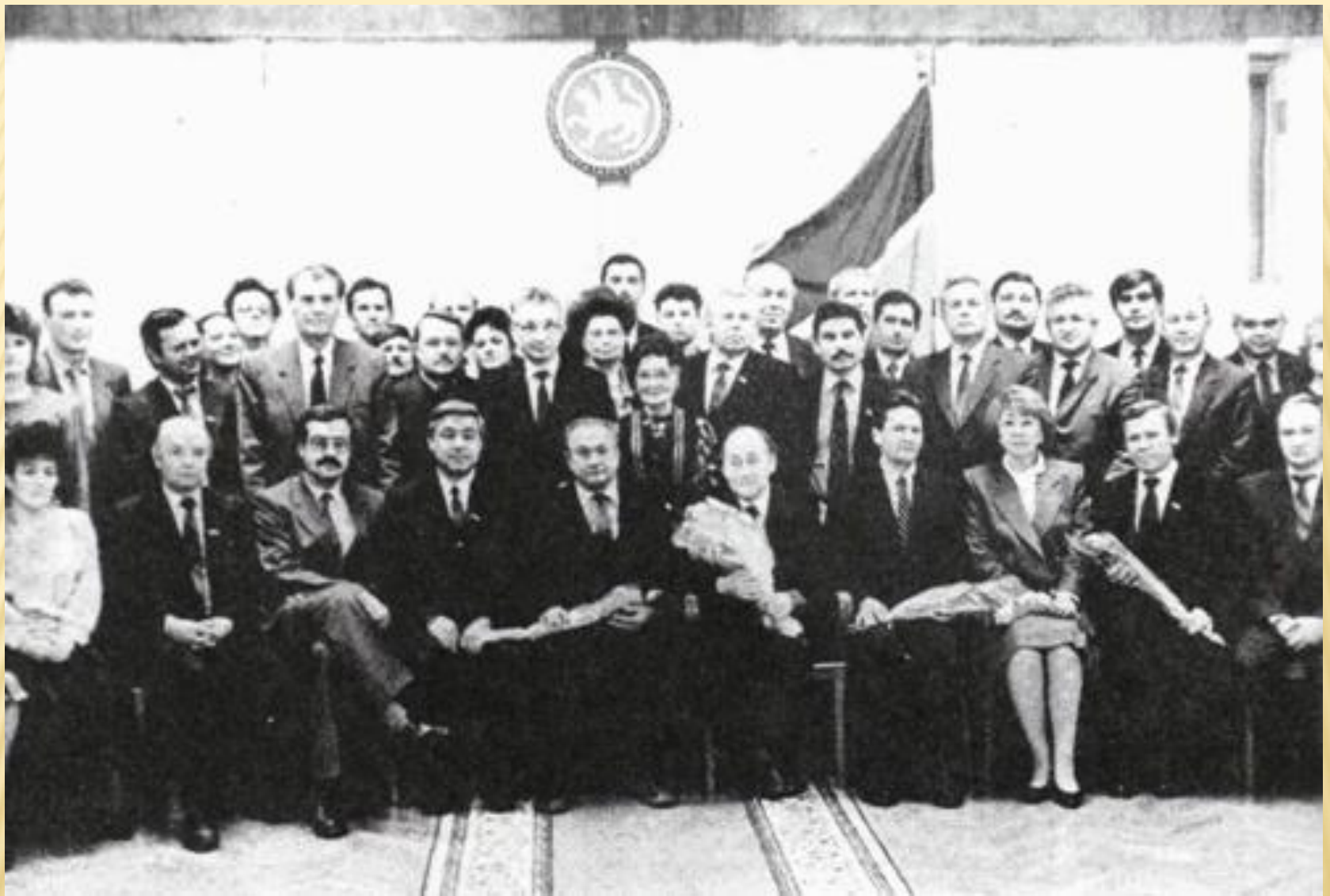
Чествование авторов государственной символики Республики Татарстан в Верховном Совете республики. Осень 1993 г.