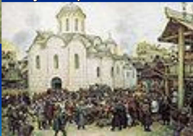
"Оборона Москвы от хана Тохтамышша"