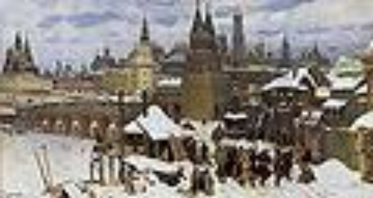
"Всесвятский каменный мост"