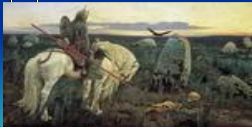
"Витязь на распутье"