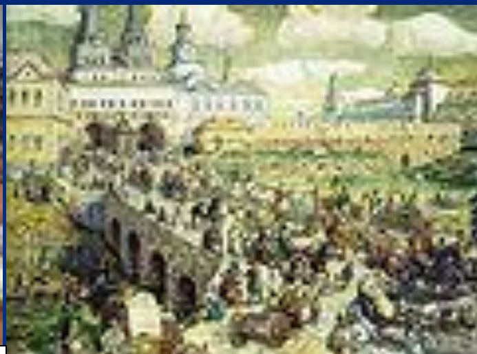
"Кремль" "Уличное движение на воскресенском мосту"