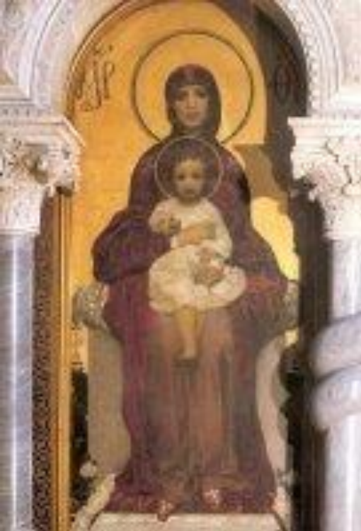
"Богоматерь с младенцем" Автопортрет