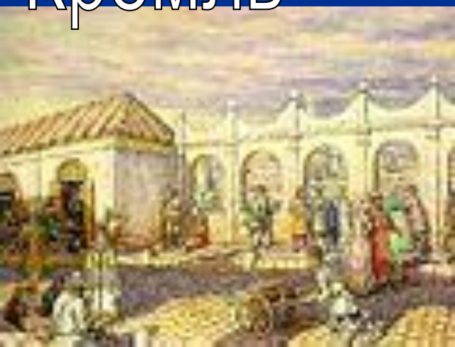
"Каменный мост в допетровские времена"