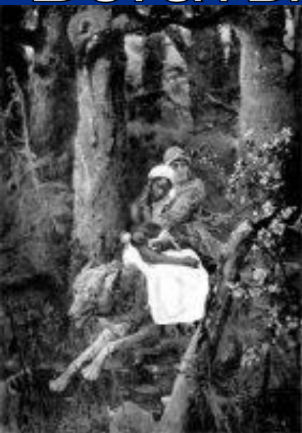
"Иван-Царевич и серый волк"