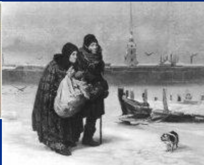
"От квартиры к квартире"