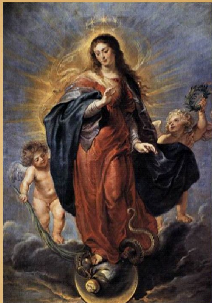
Непорочное зачатие, 1628