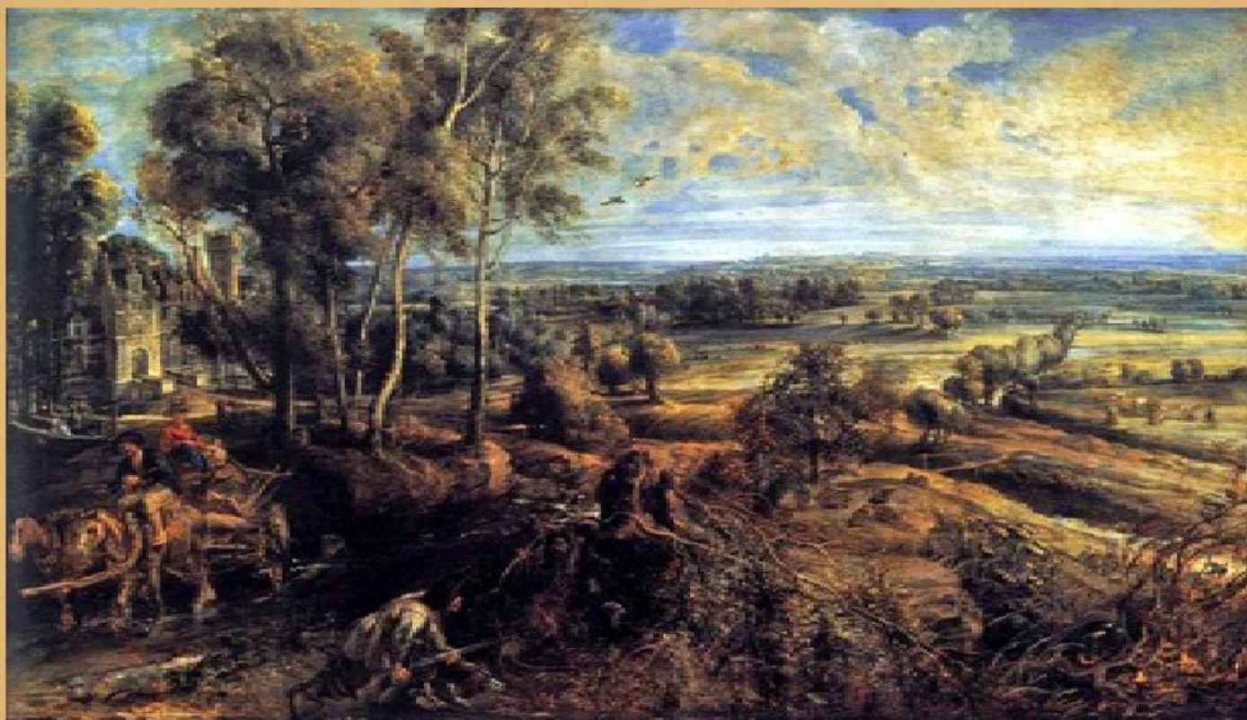
Летний пейзаж с видом Хет Стина, 1635