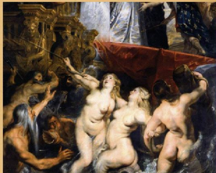
Три обнаженных. Деталь картины 'Прибытие Марии Медичи в Марсель', 1623-1625