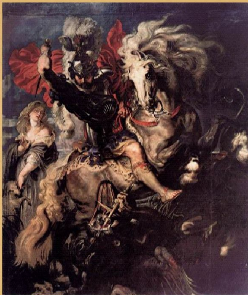
Святой Георгий, поражающий дракона, 1606-1610