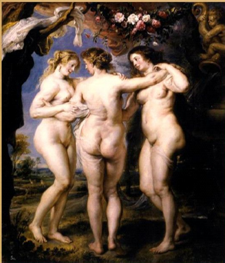
Три Грации, 1639. Дерево, масло, 221x181.