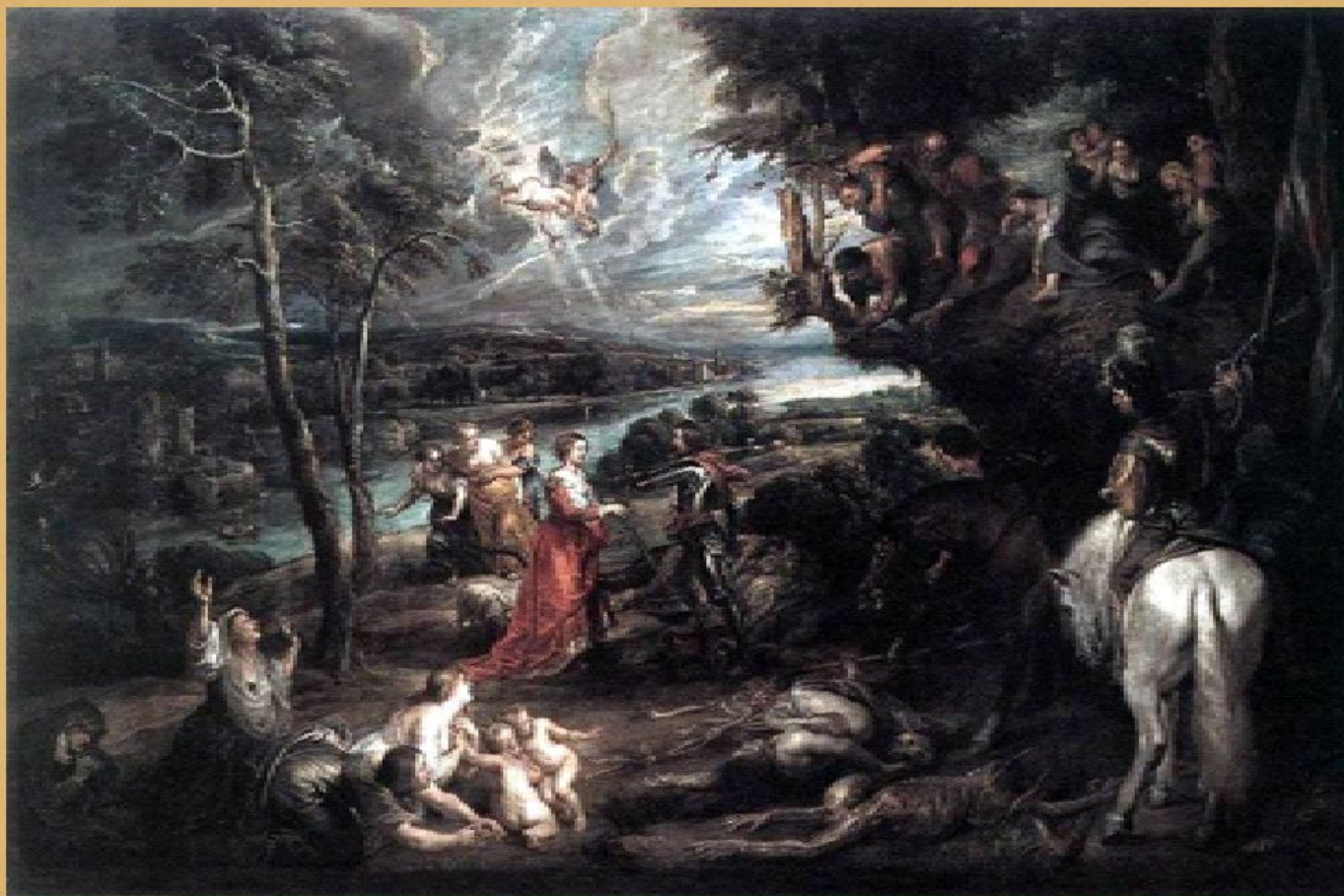
Пейзаж со Святым Георгием и Драконом, 1630