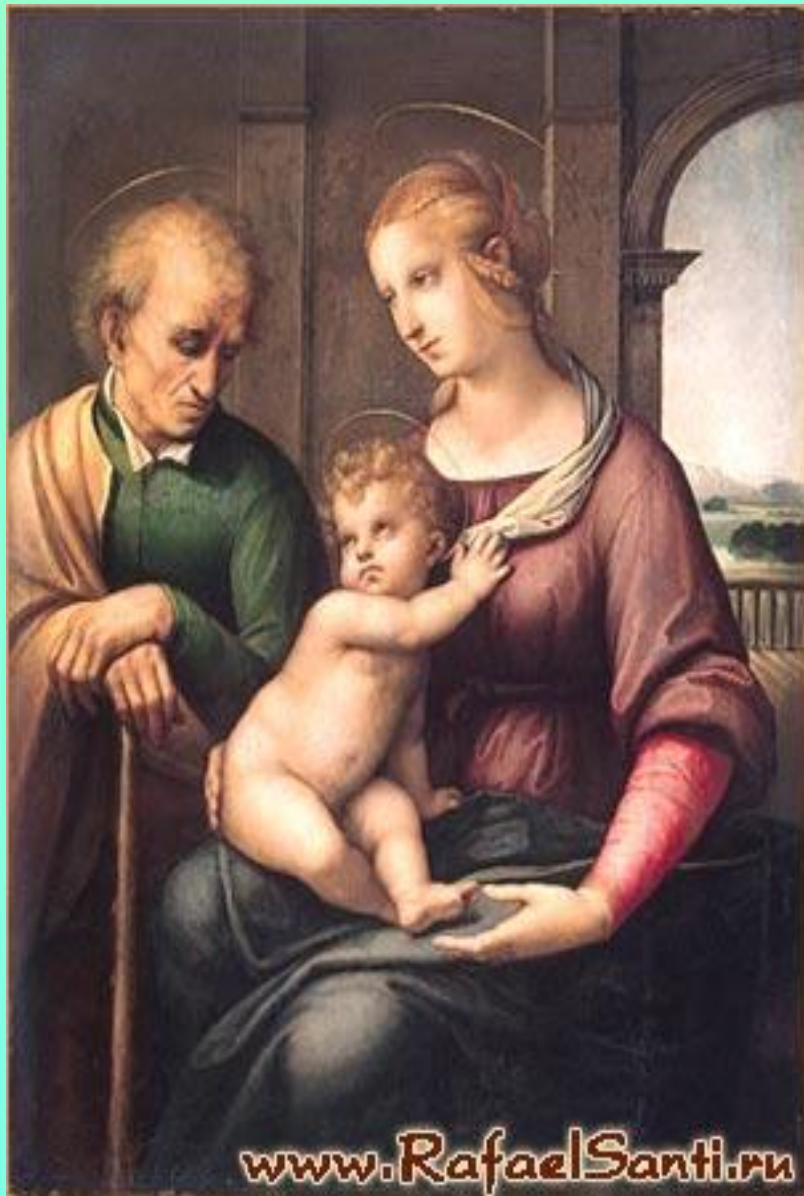
Мадонна с безбородым Иосифом. 1506г. Эрмитаж. Санкт-Петербург.

Религиозный оттенок настроения, ещё не чуждый Мадонне Конестабиле, уступает место человеческому чувству.