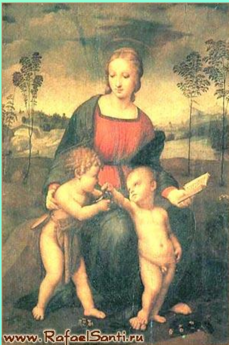
Мадонна со щеглёнком. Рафаэль. 1507г. Флоренция.Галерея. Уффици.

Источником вдохновения для «Мадонны со щеглёнком» был Микеланджело : мотив Младенца, заимствован у «Мадонны Брюгге», изваянной Микеланджело, хранящейся в церкви Нотр-Дам города Брюгге.