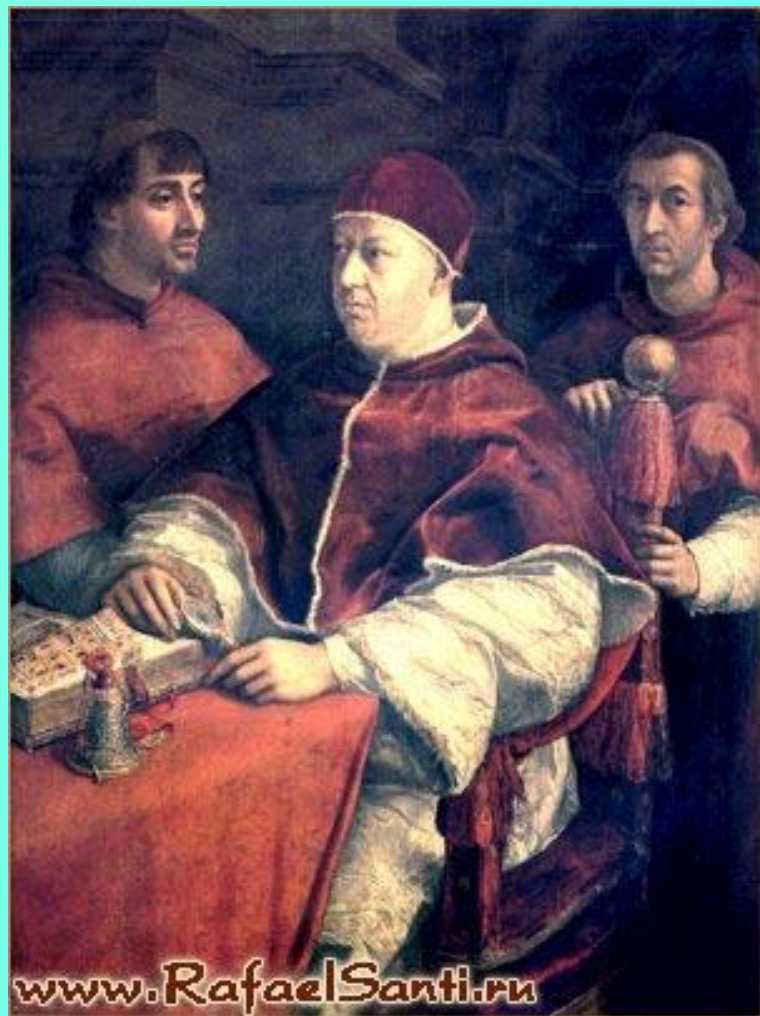
Портрет папы Льва X с двумя кардиналами. 1517 - 1519 гг. Флоренция, Уффици.

Последние семь лет своей жизни Рафаэль работал при Льве X. Лев X был большим любителем редких книг и красивых вещей, он покровительствовал художниками и сам занимался музыкой и изящной словесностью. Наибольший расцвет искусств и наук в Риме совпадает с его правлением. При нём Рафаэль начал