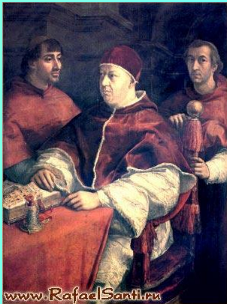
Портрет папы Льва X с двумя кардиналами. 1517 - 1519 гг. Флоренция, Уффици.

Последние семь лет своей жизни Рафаэль работал при Льве X. Лев X был большим любителем редких книг и красивых вещей, он покровительствовал художниками и сам занимался музыкой и изящной словесностью. Наибольший расцвет искусств и наук в Риме совпадает с его правлением. При нём Рафаэль начал