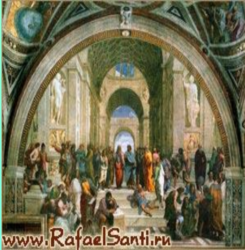
Афинская школа. Рафаэль. 1509-1511гг. Фреска. Ватикан.

Образ совершенного человека обрёл в искусстве Рафаэля вполне конкретное выражение. Это – Аристотель в знаменитой Ватиканской фреске «Афинская школа».