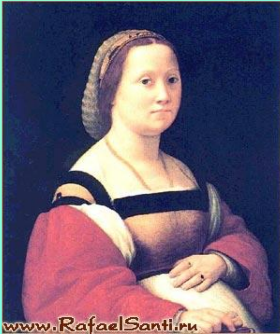
Портрет беременной женщины. Рафаэль. 1506г. Флоренция, галерея Питти.

Ценность и привлекательность Рафаэля состоит прежде всего в том, что в них наиболее ощутимо видны реалистические основы всего его искусства.