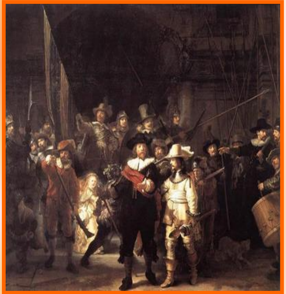
“Ночной дозор”, Рембрандт, 1642, Рейксмузеум

Героически-приподнятая композиция со сценой выступления гильдии стрелков по сигналу тревоги, историческая картина, пробуждающая воспоминания об освободительной борьбе голландского народа.