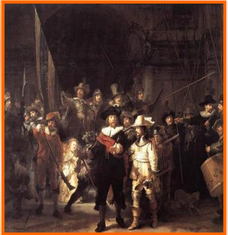
“Ночной дозор”, Рембрандт, 1642, Рейксмузеум

Героически-приподнятая композиция со сценой выступления гильдии стрелков по сигналу тревоги, историческая картина, пробуждающая воспоминания об освободительной борьбе голландского народа.