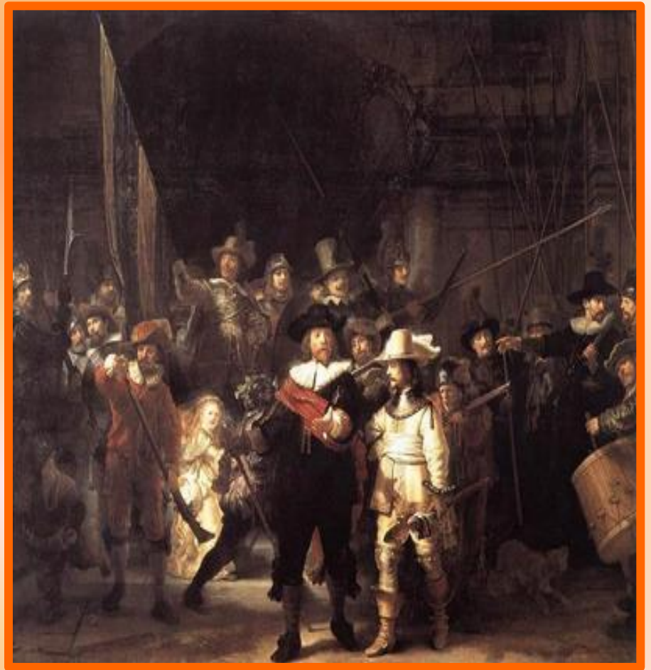
“Ночной дозор”, Рембрандт, 1642, Рейксмузеум

Героически-приподнятая композиция со сценой выступления гильдии стрелков по сигналу тревоги, историческая картина, пробуждающая воспоминания об освободительной борьбе голландского народа.