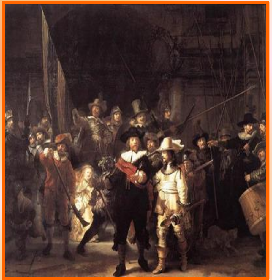
“Ночной дозор”, Рембрандт, 1642, Рейксмузеум

Героически-приподнятая композиция со сценой выступления гильдии стрелков по сигналу тревоги, историческая картина, пробуждающая воспоминания об освободительной борьбе голландского народа.