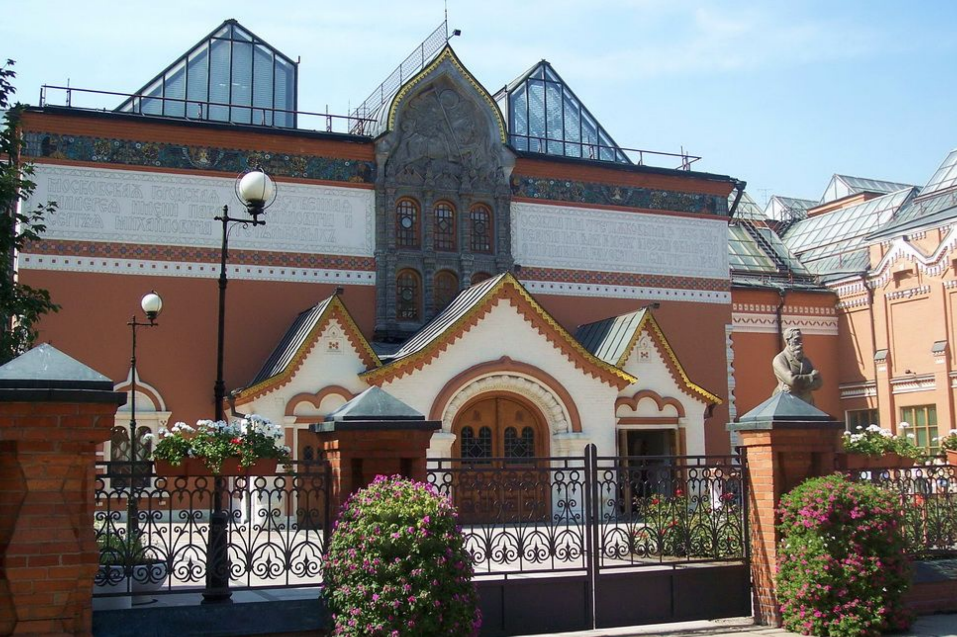
ГОСУДАРСТВЕННАЯ ТРЕТЬЯКОВСКАЯ ГАЛЕРЕЯ