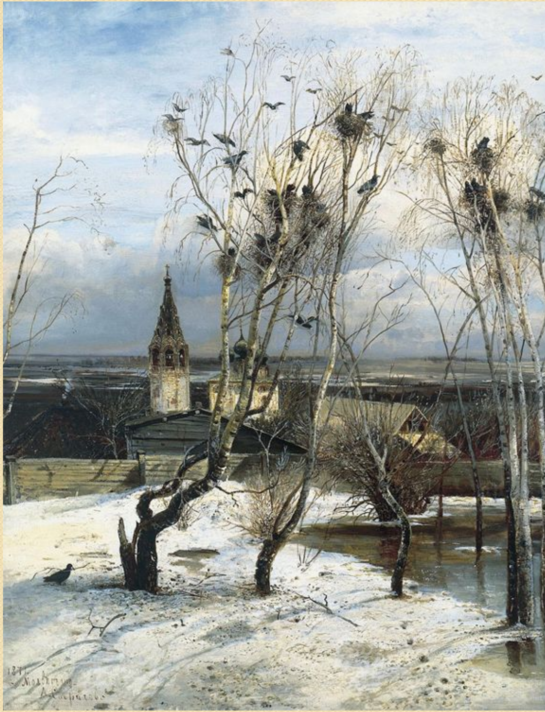
А.К. Саврасов. Грачи прилетели., 1871 Государственная Третьяковская галерея, Москва