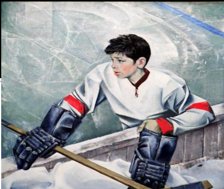
Юный хоккеист 1971год