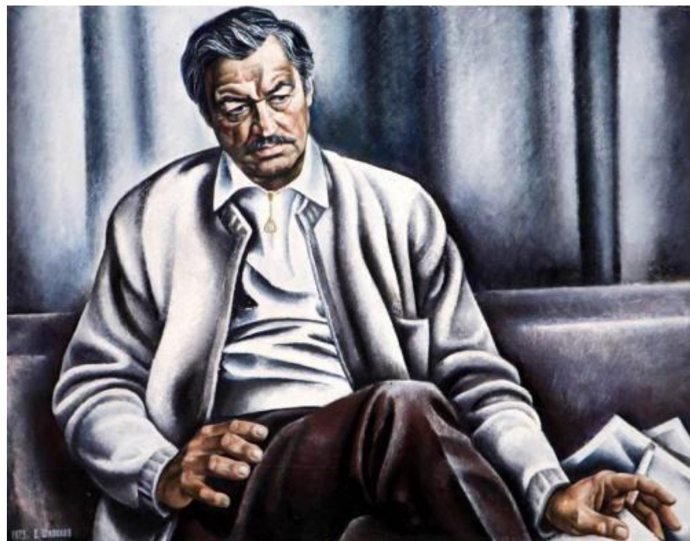
Портрет актера Е. Капеляна 1973 год