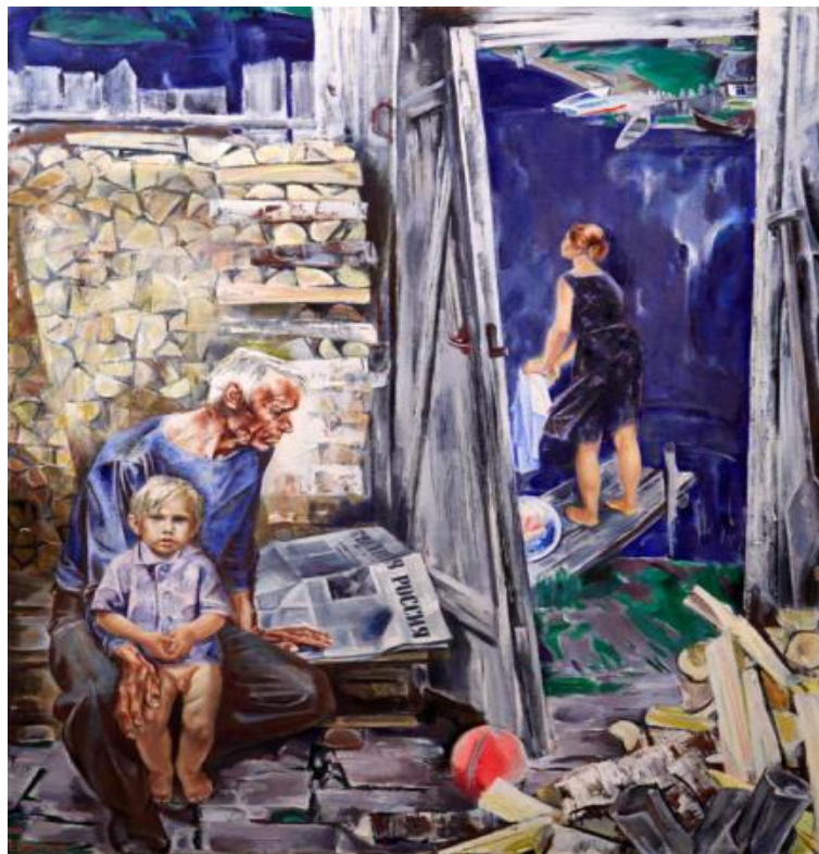
Посреди России 1983год