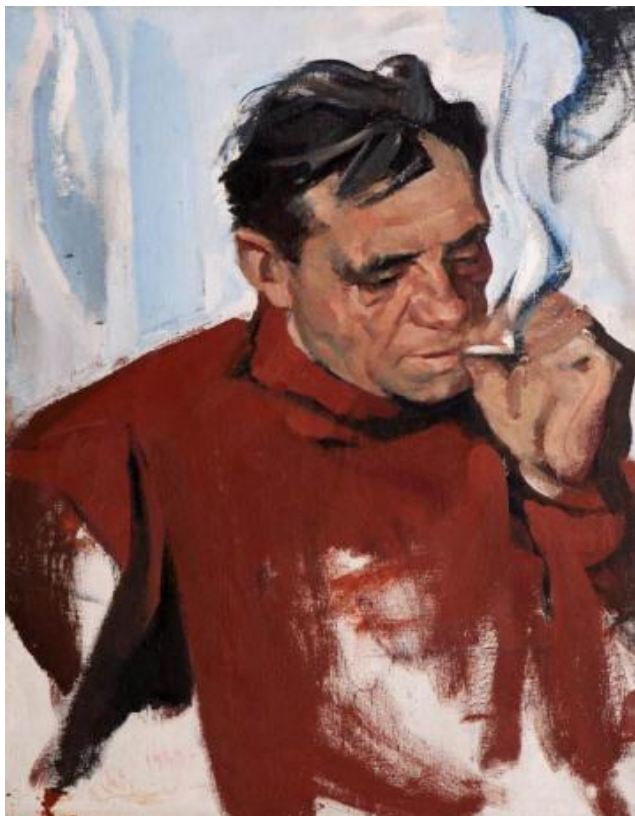
Портрет писателя В.П.Астафьева 1969год

Одной из наиболее востребованной тематической разновидностью портрета почти на десятилетие станет портрет-раздумье.