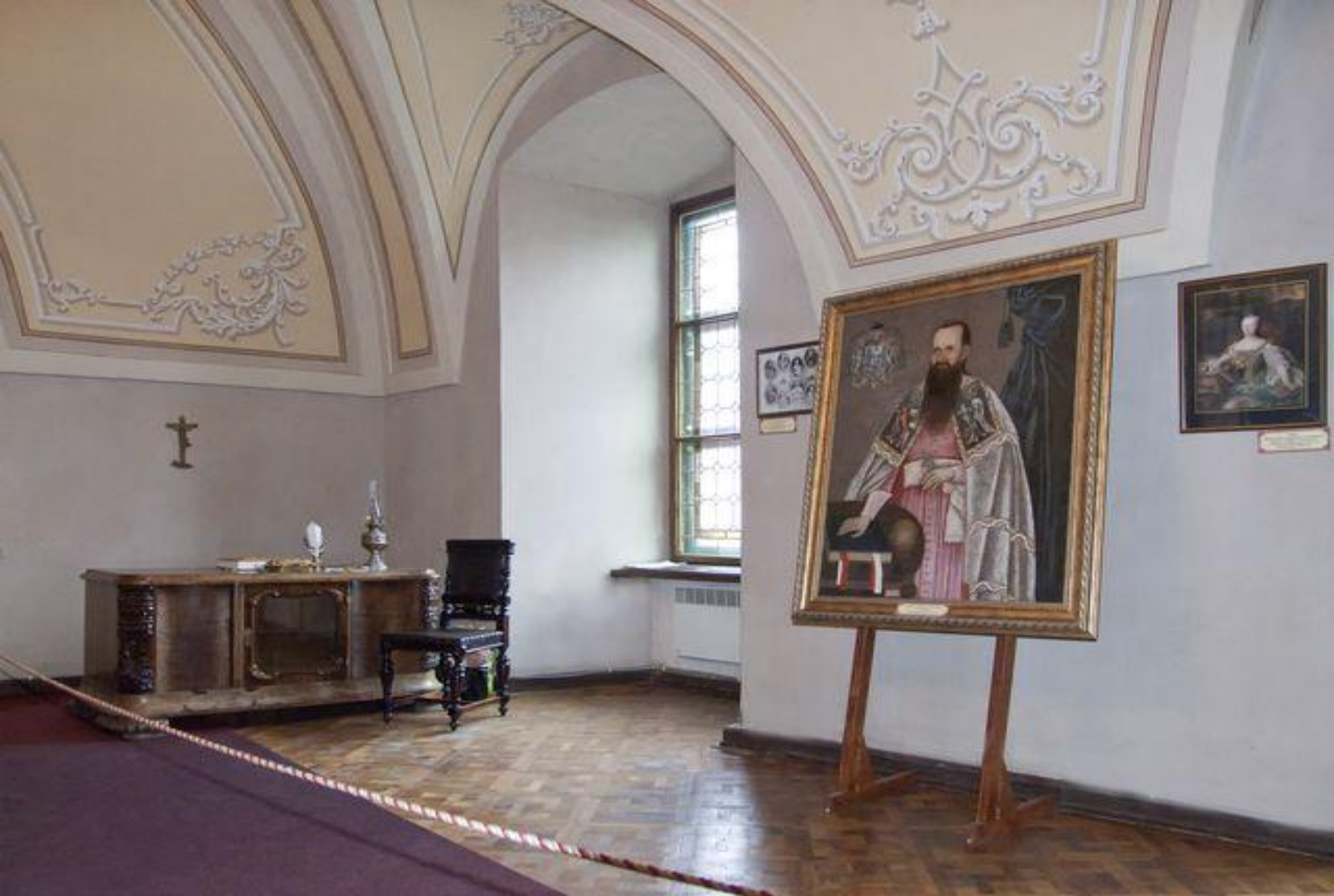
початок експозиції з історії релігії та духовної культури Закарпаття Закарпатський краєзнавчий музей