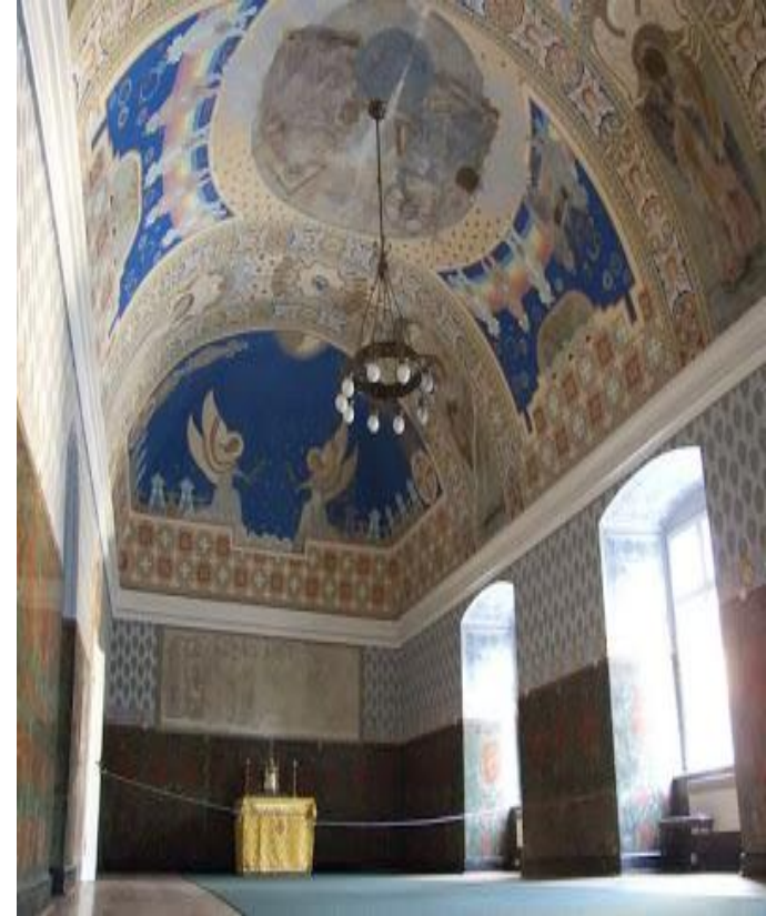
внутрішній вигляд замкової каплиці