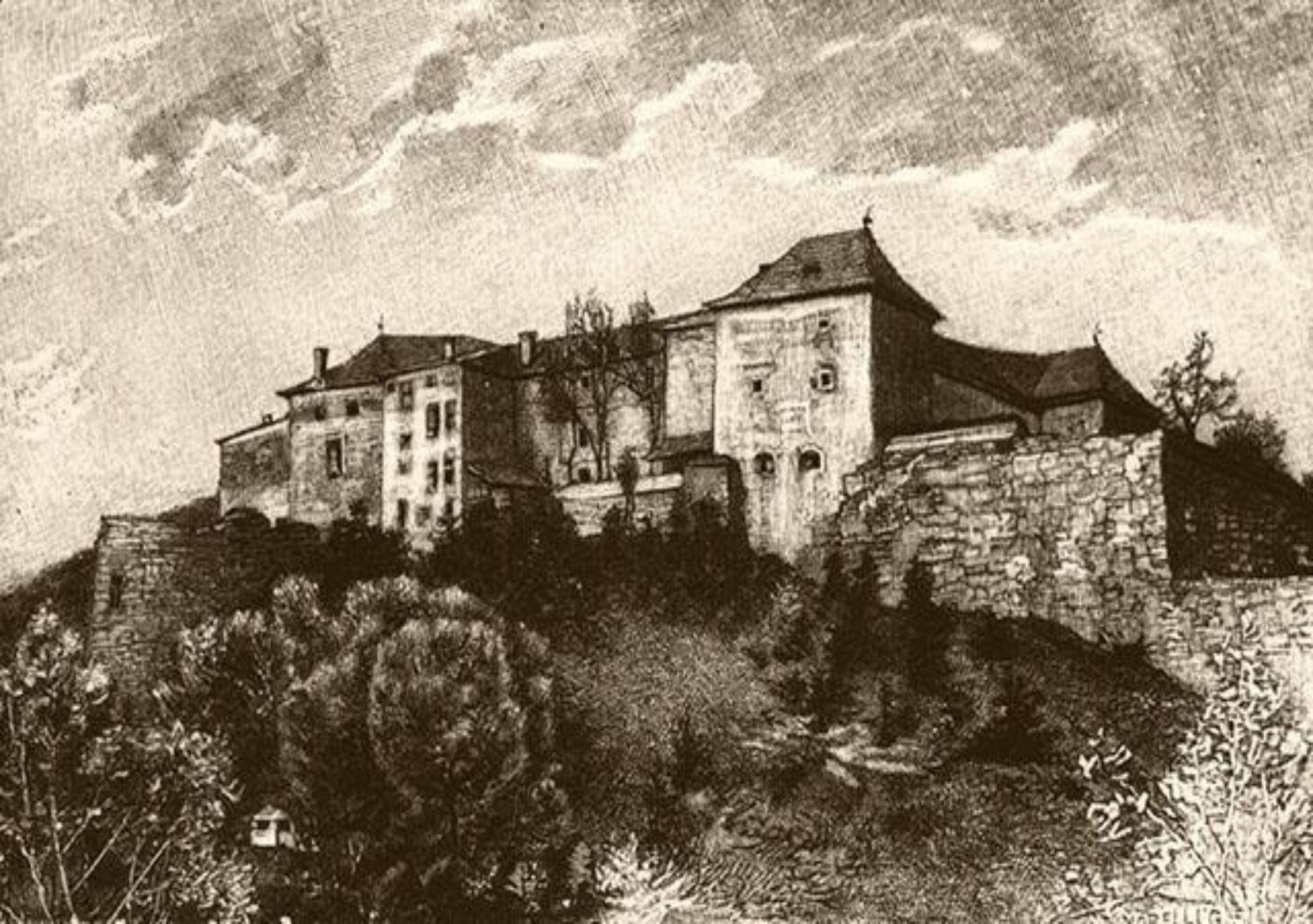
Ужгородський замок - гравюра