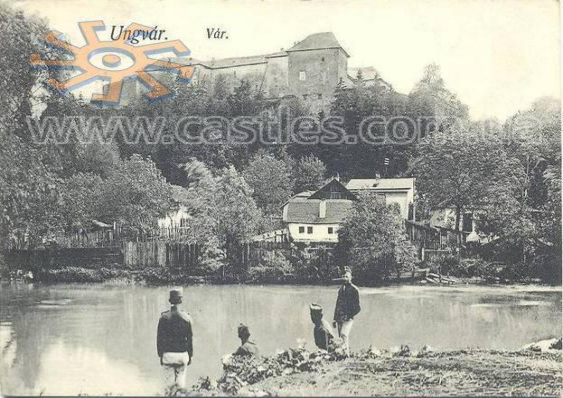
Таким був замок на початку XX ст.