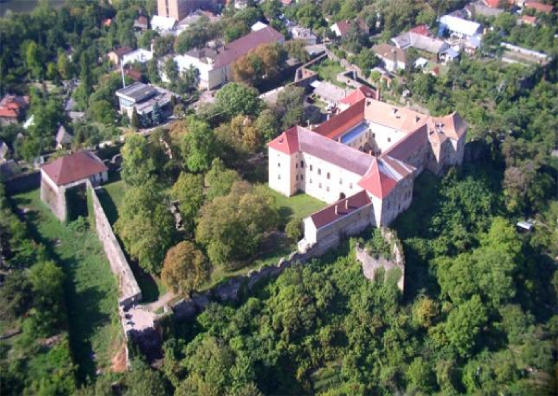
Ужгородський замок - вигляд з висоти пташиного польоту