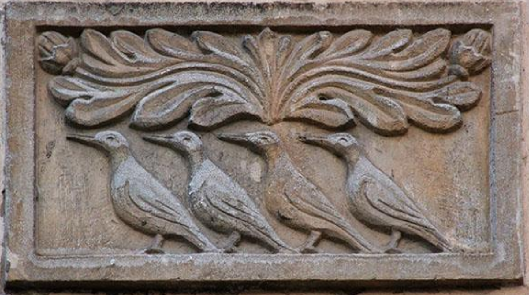
Чотири шпаки - герб Другетів