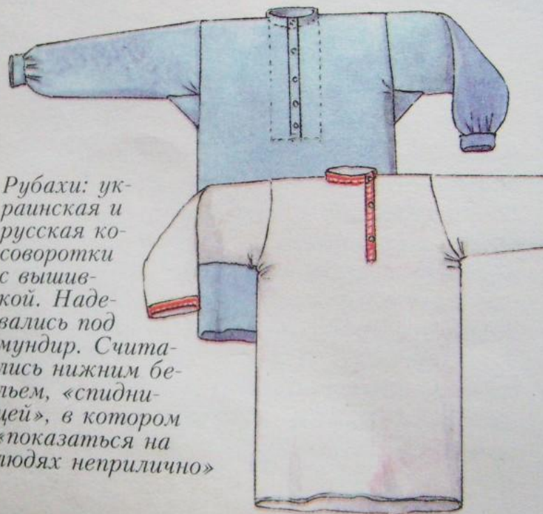
Рубахи: ук- раинская и русская ко- соворотки с вышив- кой. Наде- вались под мундир. Счита- лись нижним бе- льем, «спидни- цей», в котором «показаться на людях неприлично»