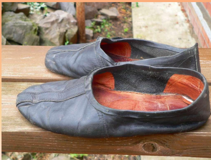
Чирики – туфли-галоши, которые надевали поверх ичиг