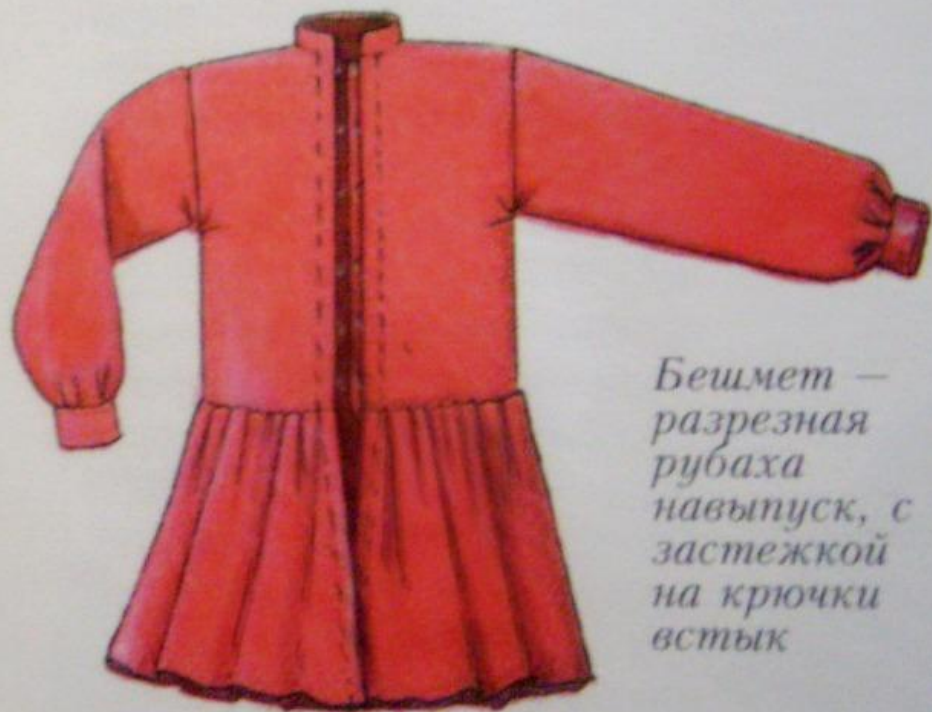
Бешмет — разрезная рубаха навыпуск, с застежкой на крючки встык