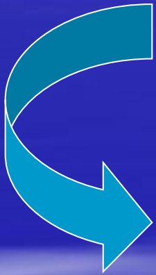
Места для зрителей