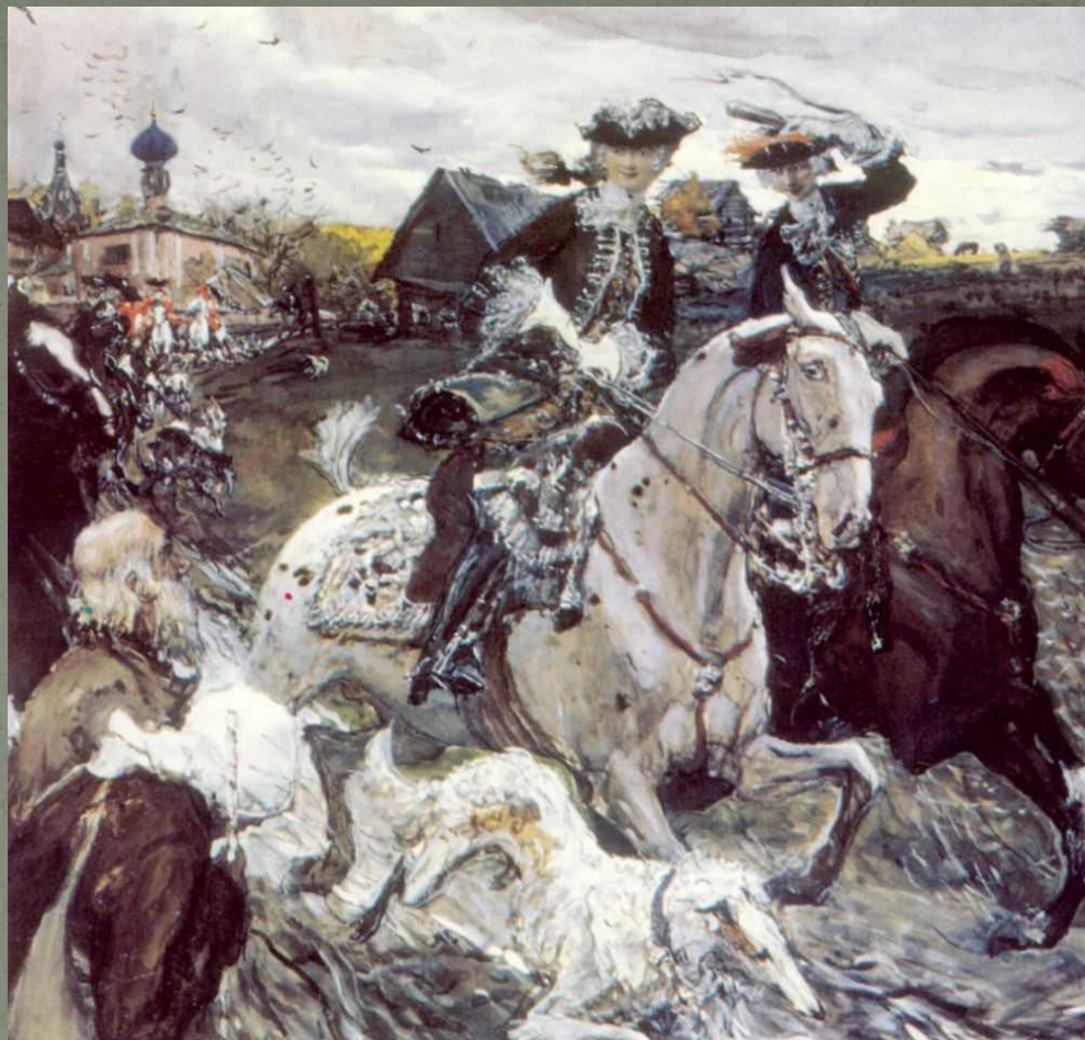
«Выезд на охоту Петра II и Елизаветы Петровны».