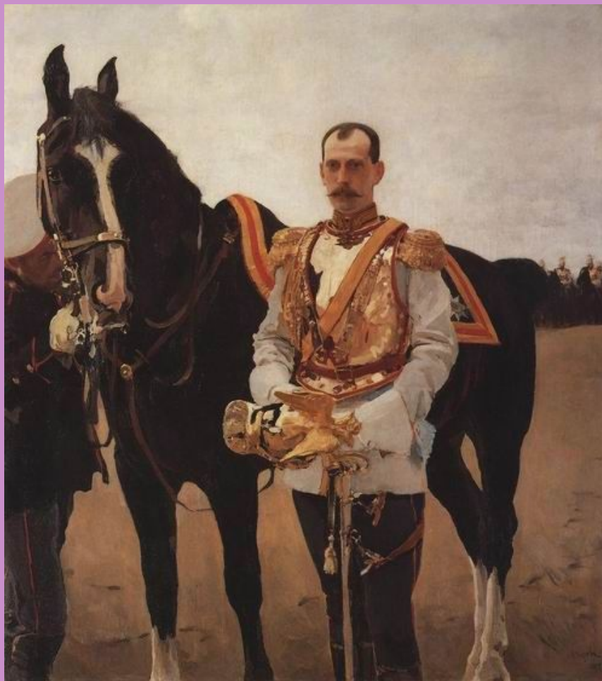
Портрет великого князя Павла Александровича