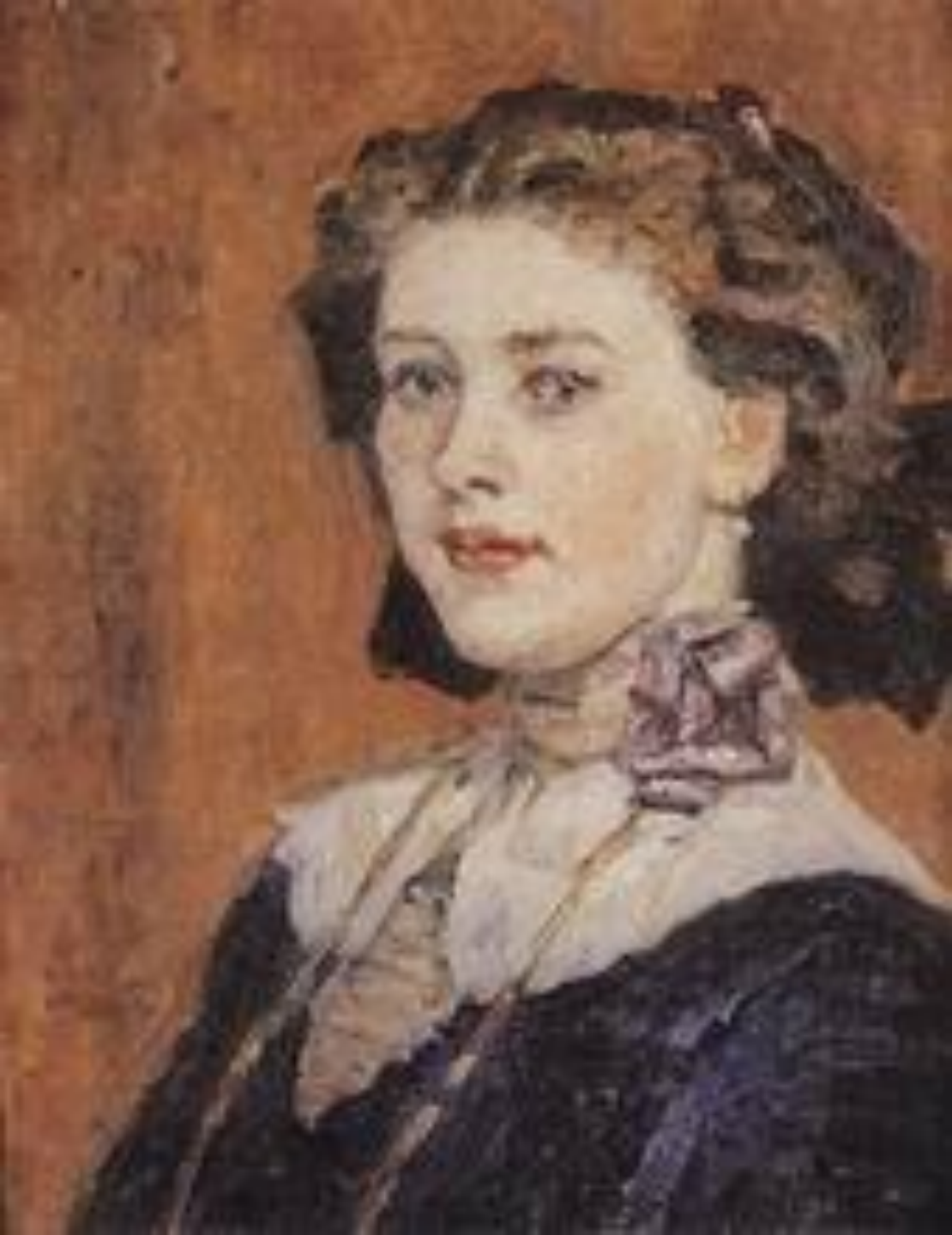
Портрет молодой женщины. 1911