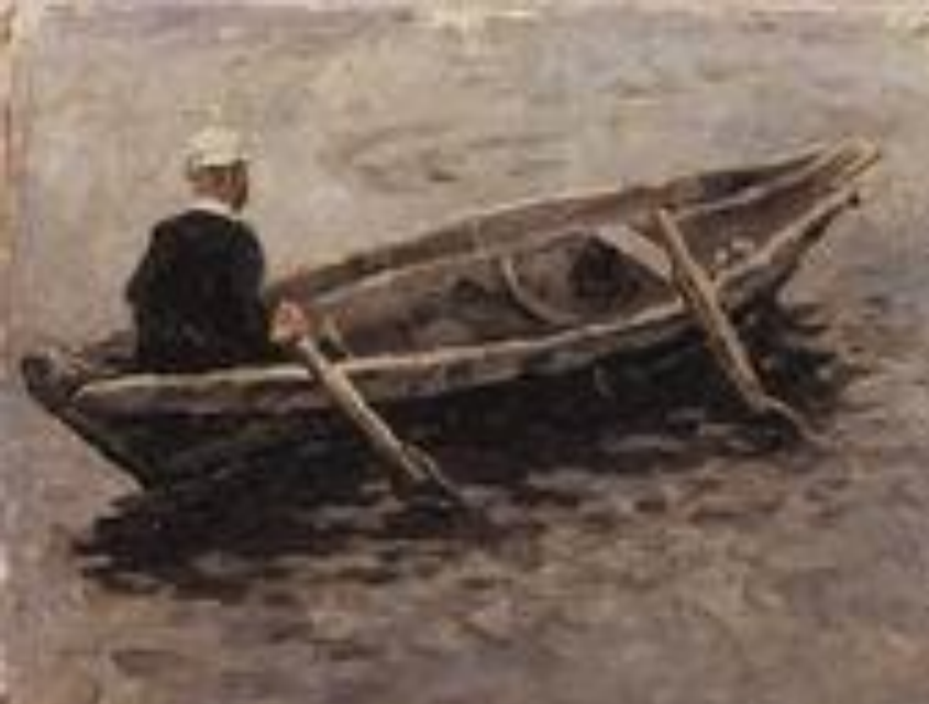
В лодке. Этюд для картинны Покорение Сибири Ермаком