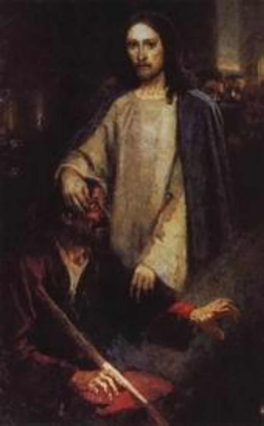
Исцеление слепорожденного Иисусом Христом. 1888