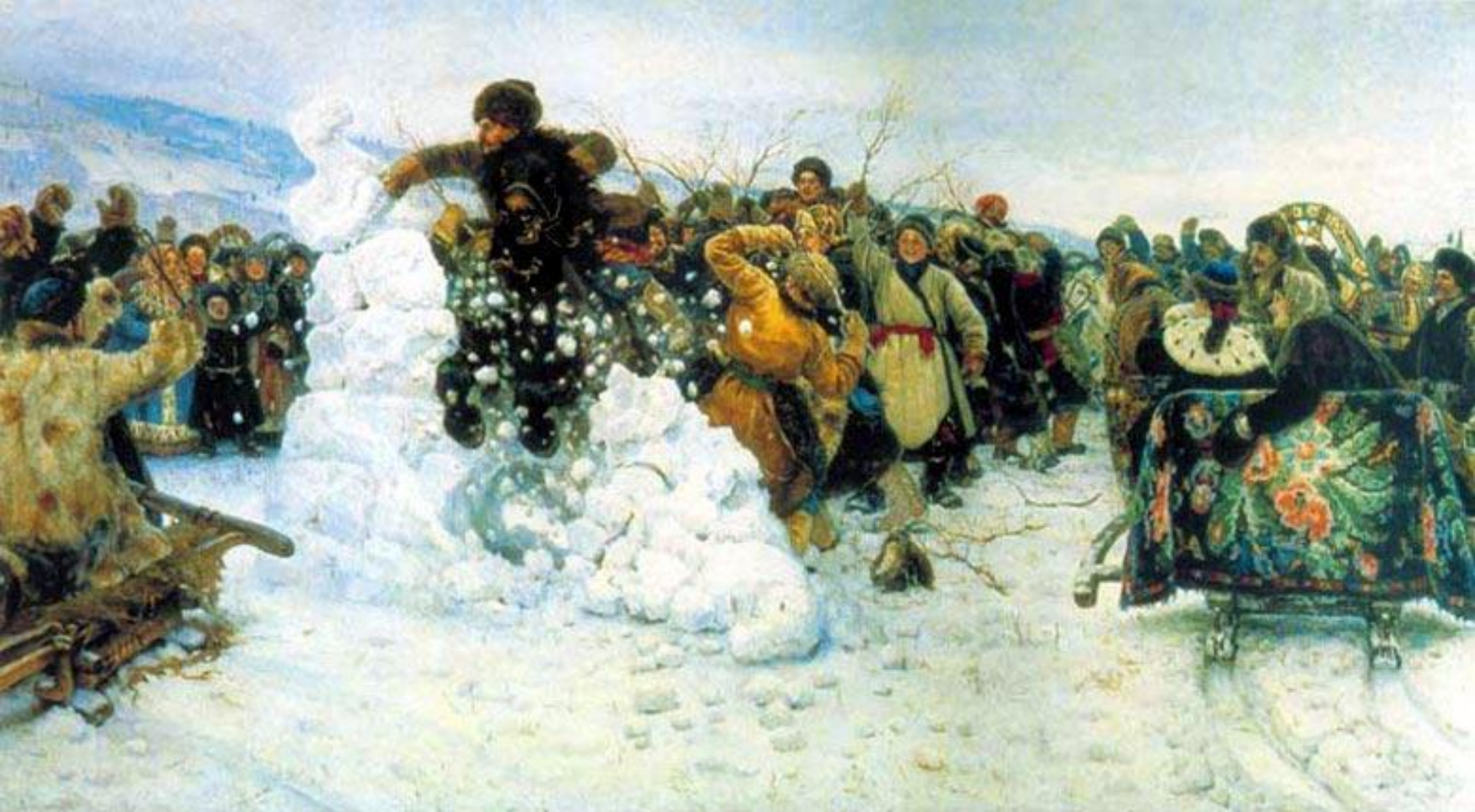
Взятие снежного городка. 1891