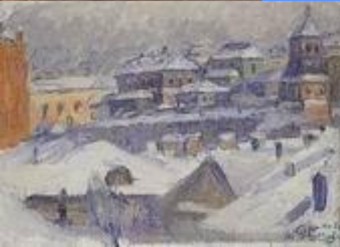
Вид Москвы 1908