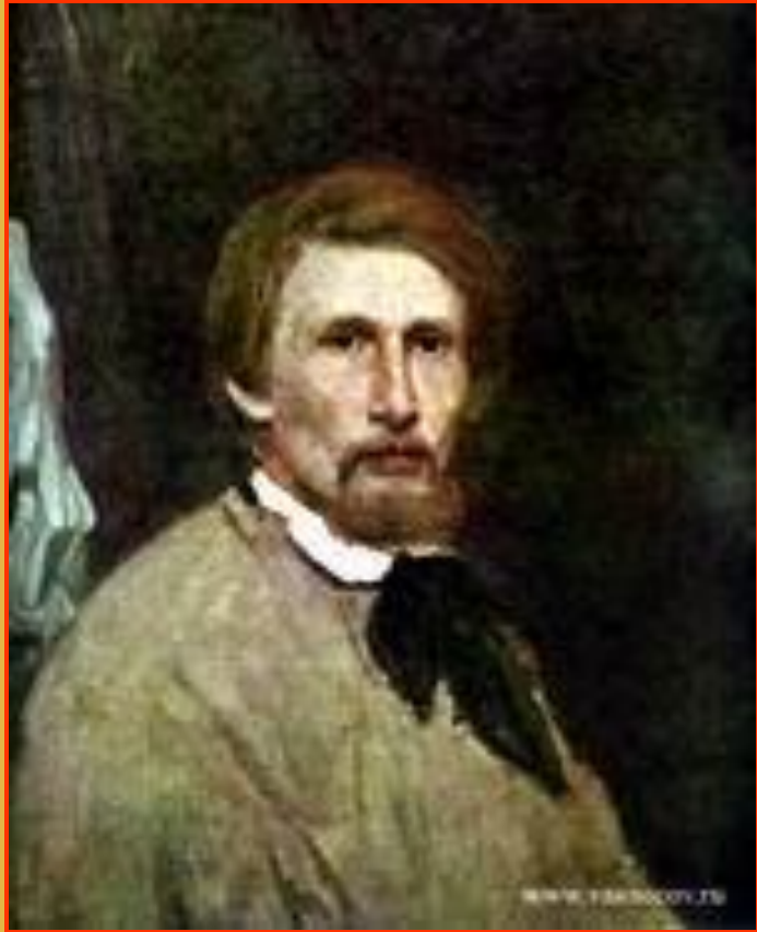
Васнецов Виктор Михайлович 1848-1926