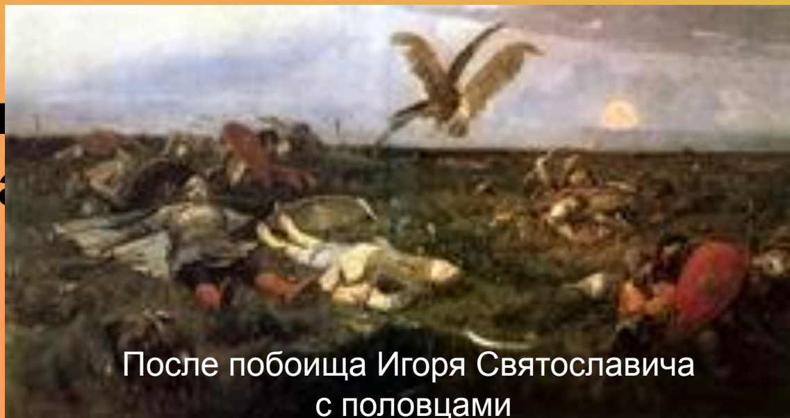
После побоища Игоря Святославича с половцами

Несколько картин объединяет одна тема, посвящённая «Слову о полку