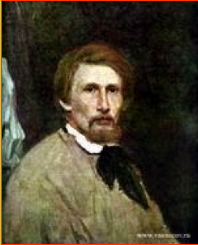
Васнецов Виктор Михайлович 1848-1926