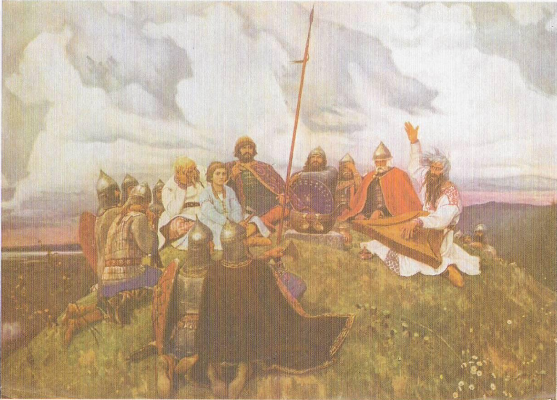
В. М. Васнецов. Баян.