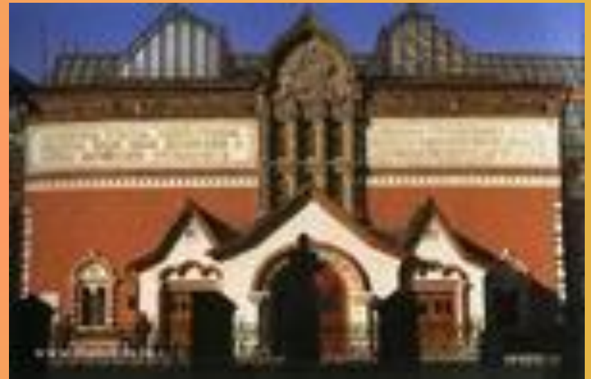
фасад Третьяковской галереи

По чертежам В.М. Васнецова исполнены некоторые архитектурные работы: церковь в Абрамцеве, фасады Третьяковской галереи, Музея Цветкова и другие работы