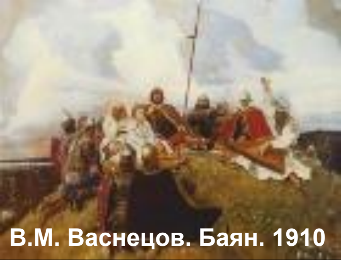
В.М. Васнецов. Баян. 1910