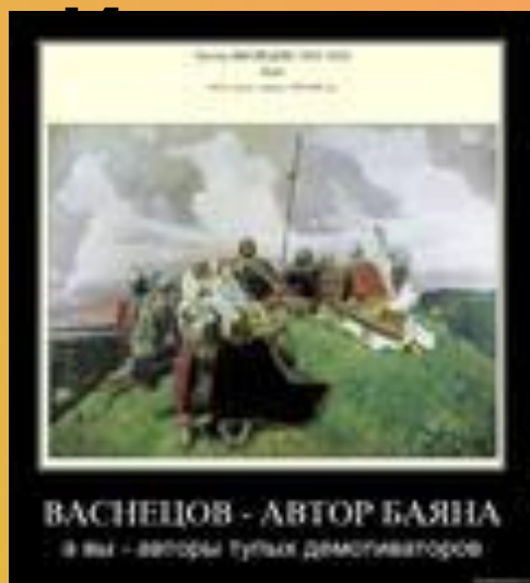
ВАСНЕЦОВ - АВТОР БАЯНА и вы - авторы тулук демогиваторов