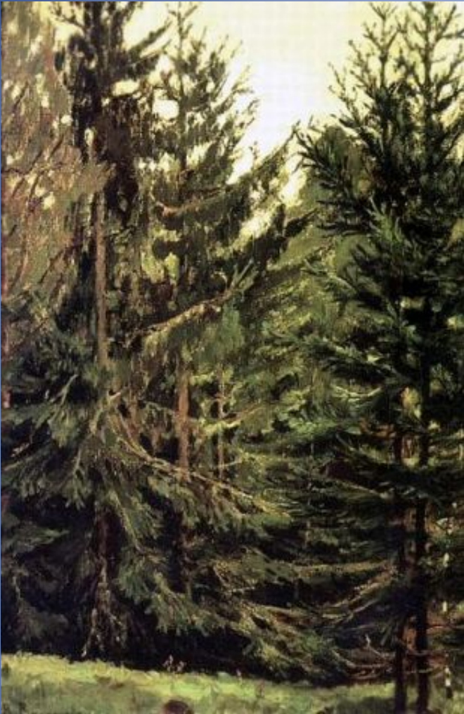
В. М. Васнецов. Опушка елового леса Этюд к картине "Аленушка" 1881г, холст, масло, Государственная Третьяковская галерея, Москва.