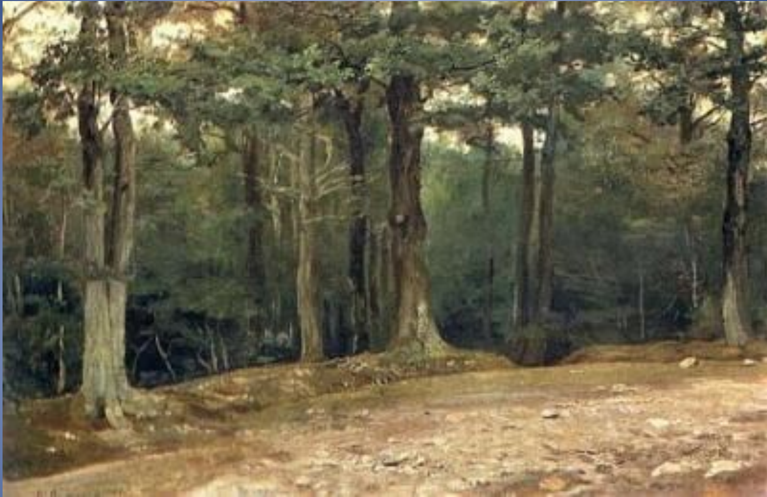
В.М. Васнецов . В парке Конец 1870-х, холст, масло, Государственная Третьяковская галерея, Москва.