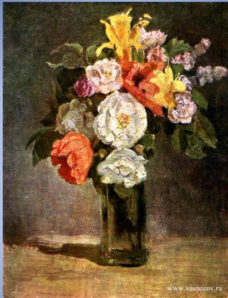
Букет. 1880 г. Холст, масло.