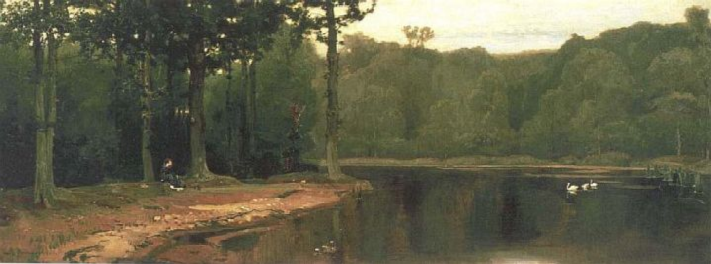
В.М. Васнецов . Затишье 1881г, холст, масло, Государственная Третьяковская галерея, Москва.