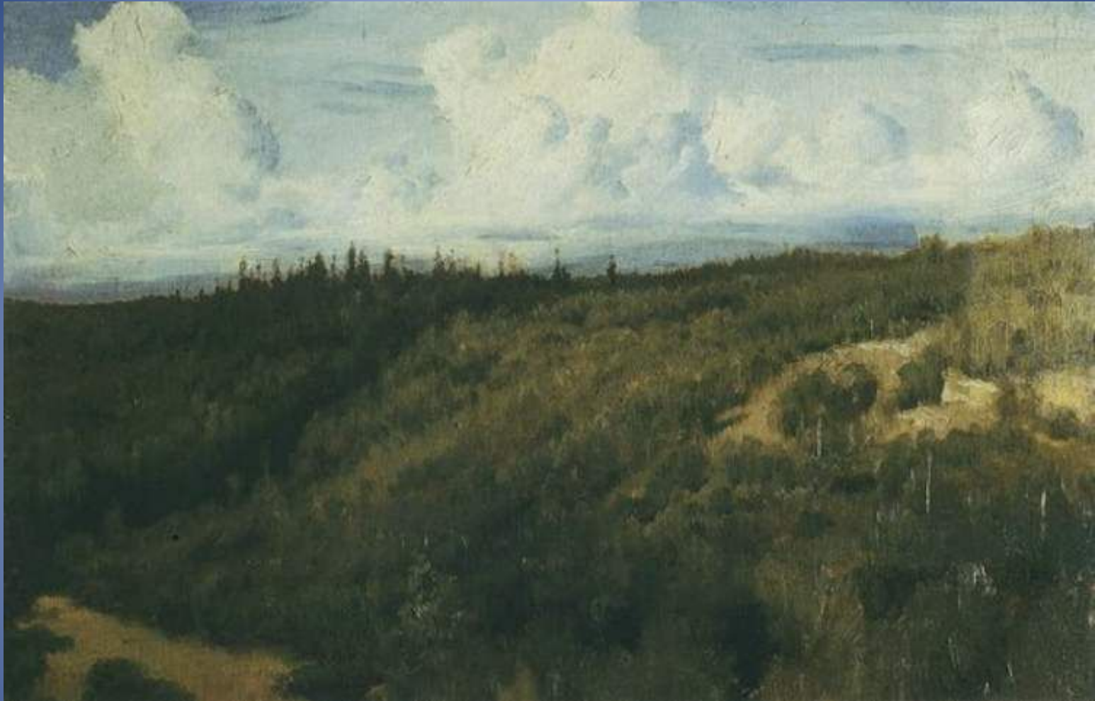
В.М. Васнецов Пейзаж под Абрамцевым Этюд для картины "Богатыри« 1881г, холст, масло, Государственная Третьяковская галерея, Москва.