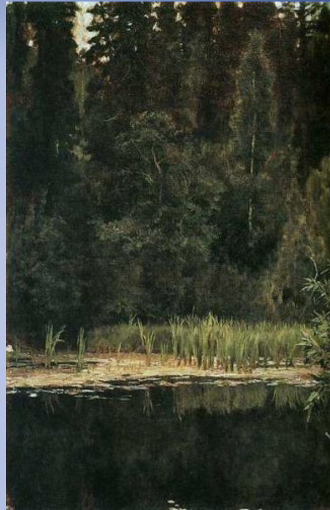
В.М. Васнецов . Алёнушкин пруд ( Пруд в Ахтырке ) 1880г, холст, масло, Государственный историко-художественный и литературный музей-заповедник "Абрамцево", Московская область