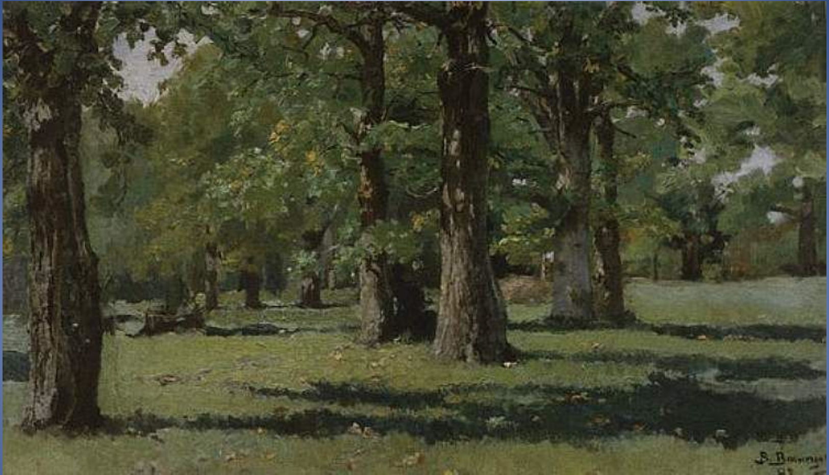
Дубовая роща в Абрамцево 1883г, холст, масло, Государственная Третьяковская галерея, Москва.