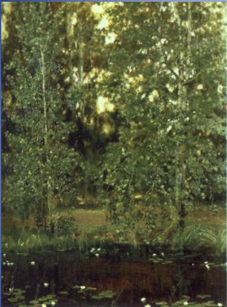
Пруд в Ахтырке 1880г, холст, масло, Государственная Третьяковская галерея, Москва.