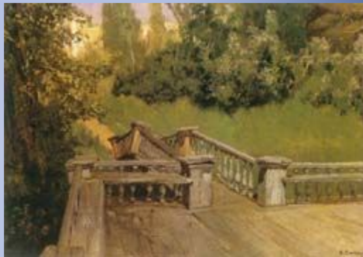
Ахтырка. Эюд. 1879, холст, масло.