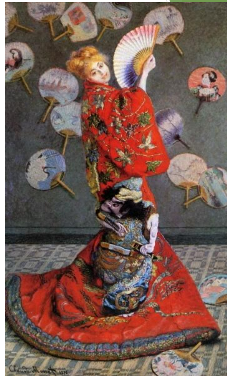
Клод Оскар Моне: Клод Моне - Camille Monet in Japanese Costume, 1876