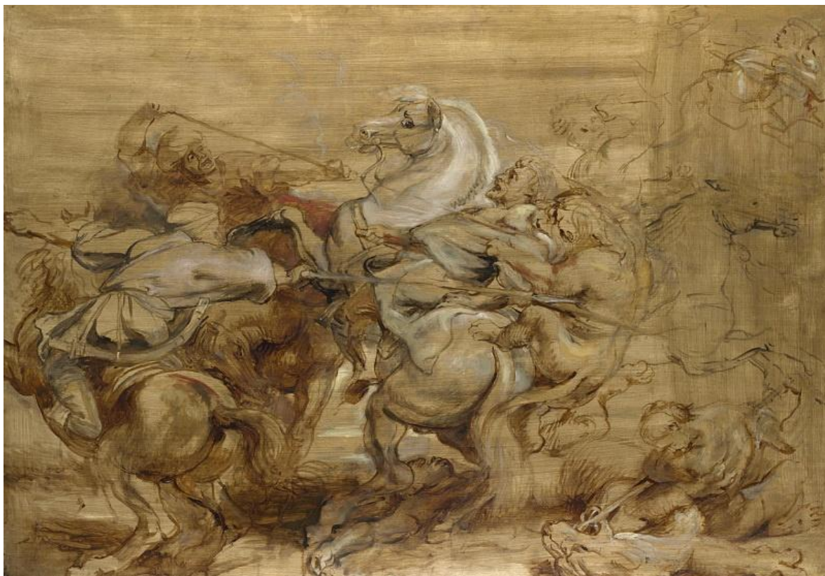
Питер Пауль Рубенс: Охота на львов