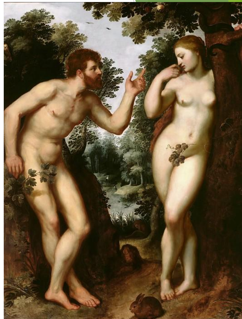
Питер Пауль Рубенс: Адам и Ева