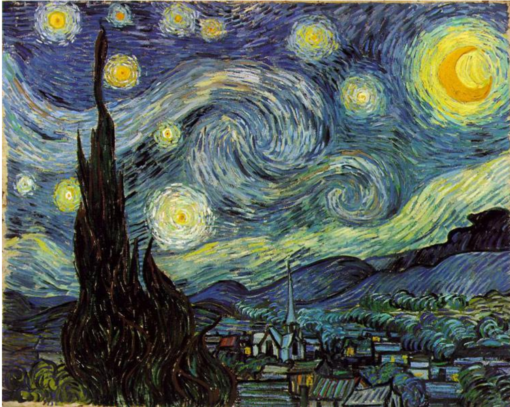
Звездная ночь, 1889. Холст, масло, 73x92. Музей современного искусства, Нью-Йорк