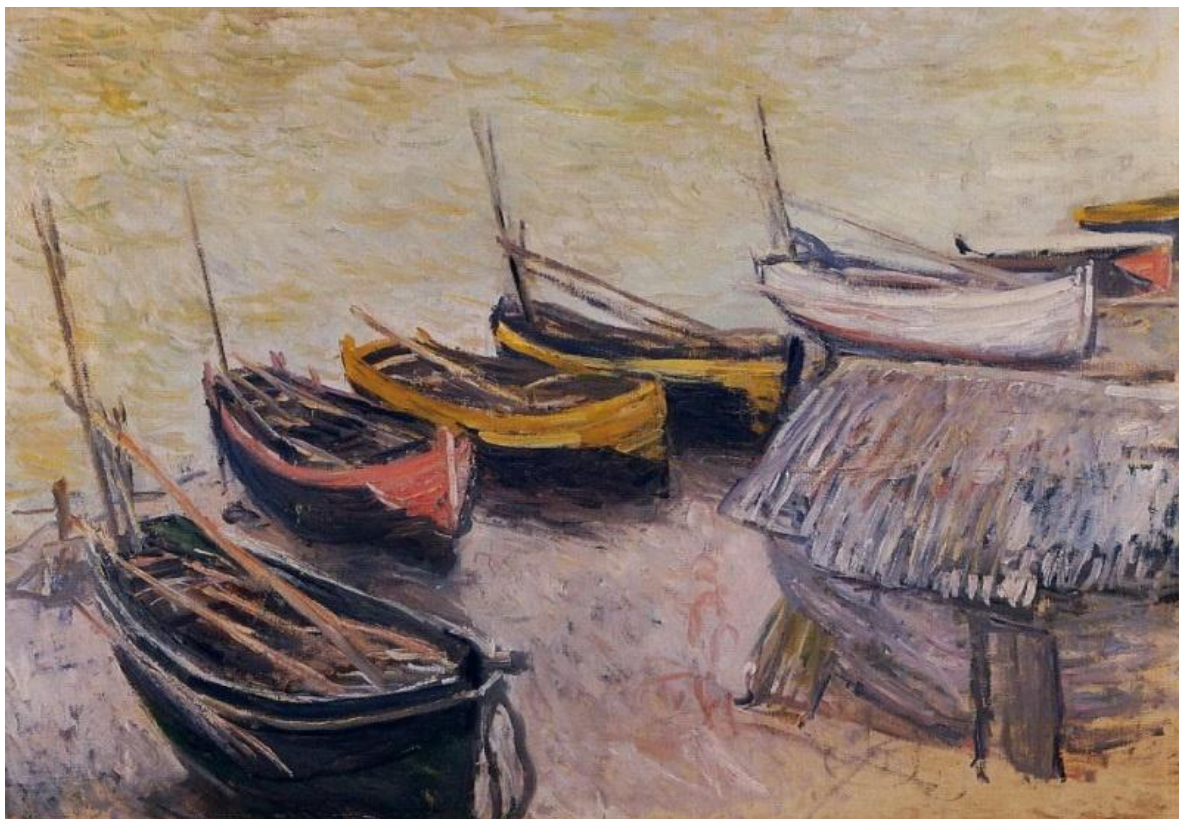
Клод Оскар Моне: Клод Моне - Boats on the Beach, 1883 ( «Лодки на берегу» )