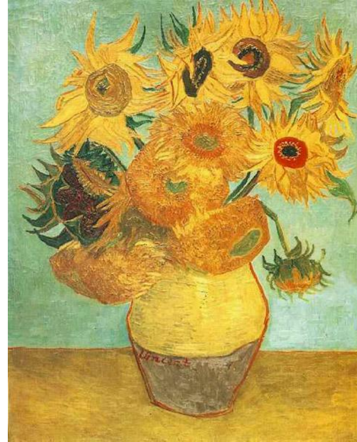
Ваза с двенадцатью подсолнухами. Арль, январь, 1889. Холст, масло. Филадельфия. Филадельфийский Музей изобразительных искусств, США