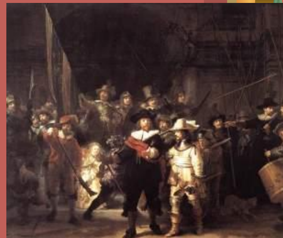
Ночной дозор 1642 г