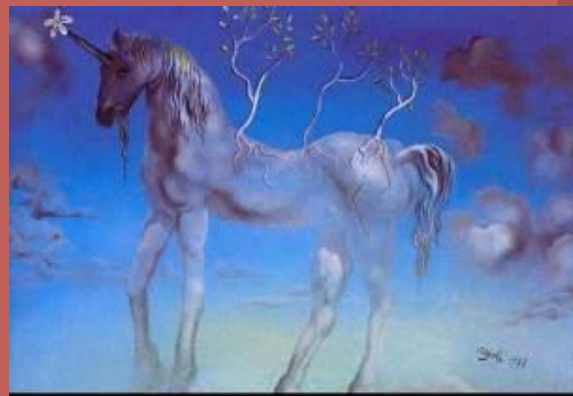
Весёлый единорог 1977г.