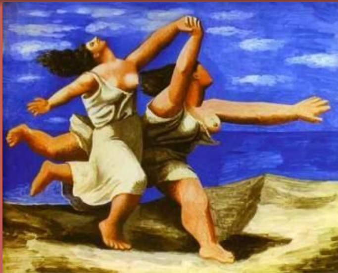
девушки бегущие по берегу