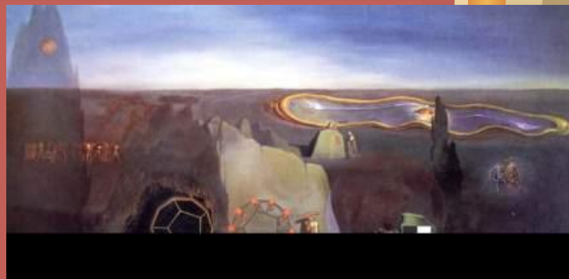
В поисках четвёртого измерения 1979г.