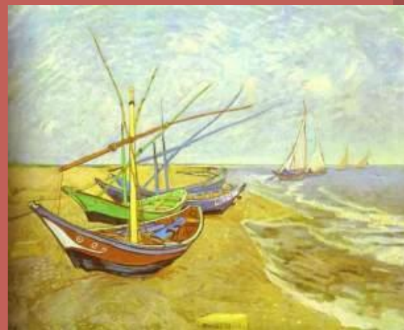
Рыбацкие лодки на берегу 1888г.

Если импрессионистов цвет интересовал главным образом как средство передачи природы, то для писавшего широкими вихреобразными мазками Ван Гога он был символом, выразительным средством. В 1888 г. художник поселился в Арле, где создал очень много картин, но страдал от участвовавших нервных срывов, галлюцинаций и приступов депрессии. К нему приезжал Гоген, однажды они поссорились, после чего в приступе безумия Ван Гог отрезал себя часть уха. За последние 70 дней жизни он написал 70 картин. После смерти слава художника быстро росла. Эмоциональная глубина его творчества оказала огромное влияние на искусство 20 века, в частности на фовизм и экспрессионизм.