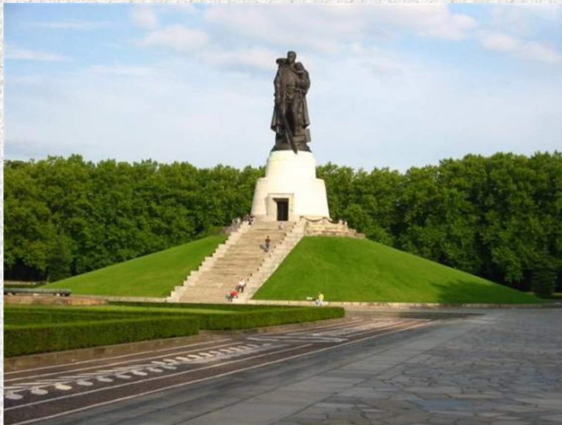
Е. Вучетич. Воин-освободитель в Трептов-парке (Берлин)