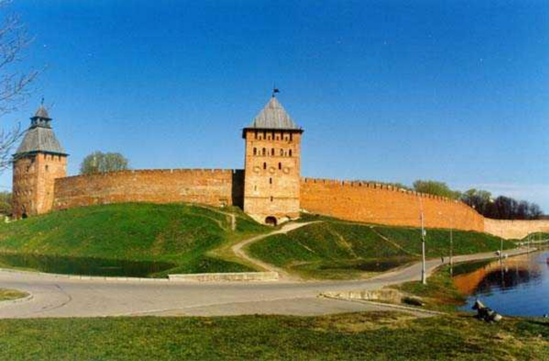
Башня Дворцовая. XV-XVII в.