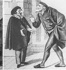
Пульчинелла и Панталоне