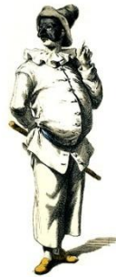
Пульчинелла, рисунок Мориса Санда