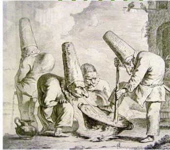
Пульчинеллы, офорт XVIII в.