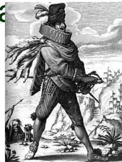
Испанский капитан, гравюра кон XVII в