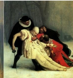
Жан Леон Жером