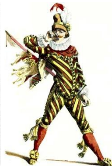
Капитан, рисунок Мориса Санда