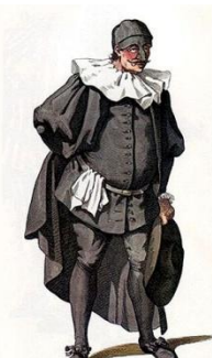
Доттор, рисунок Мориса Санда