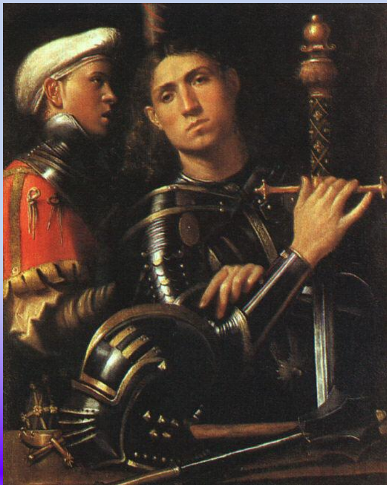
Воин со своим оруженосцем.