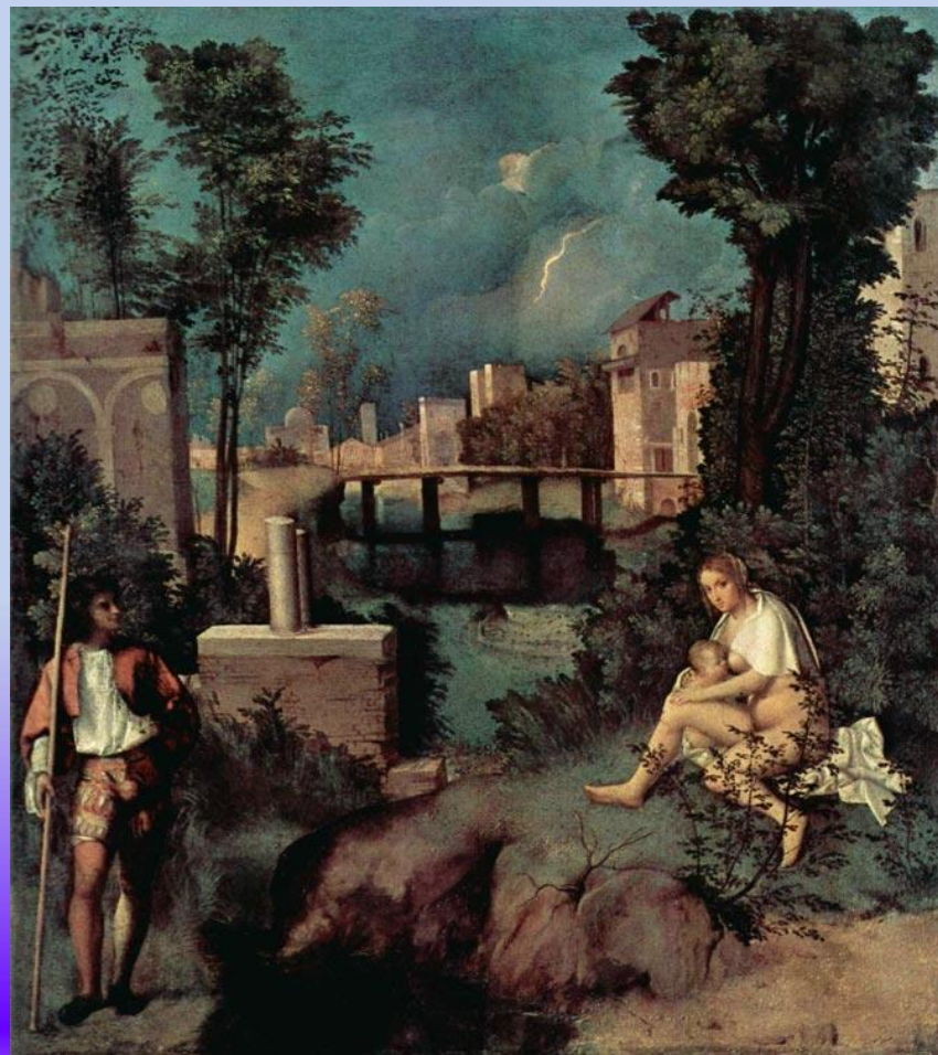
Гроза 1505. Галерея академии, Венеция.