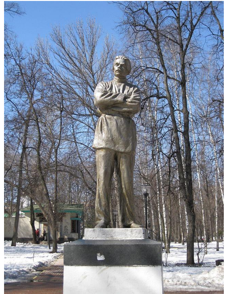
«Памятник М. Горькому»