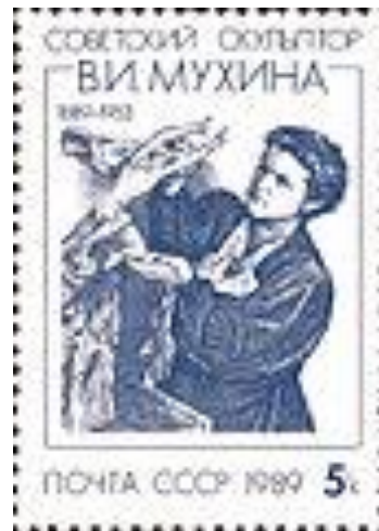
Почтовая марка СССР