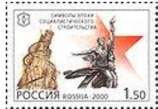
Почтовая марка России: Символы эпохи социалистического строительства