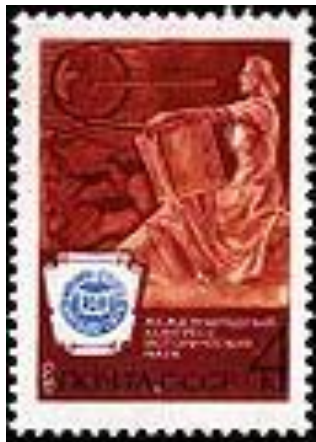
Почтовая марка СССР: Скульптура «Наука»