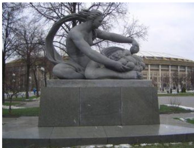
«Земля» и «Вода»