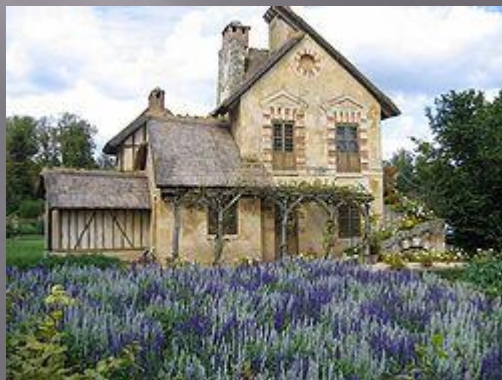
Ферма Марии- Антуанетты