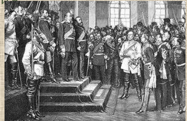
Провозглашение Германской империи в 1871 г.

Мирный договор с Францией был подписан 26 февраля тоже в Версале. В марте эвакуировавшееся французское правительство переместило столицу из Бордо в Версаль, и лишь в 1879 снова в Париж.