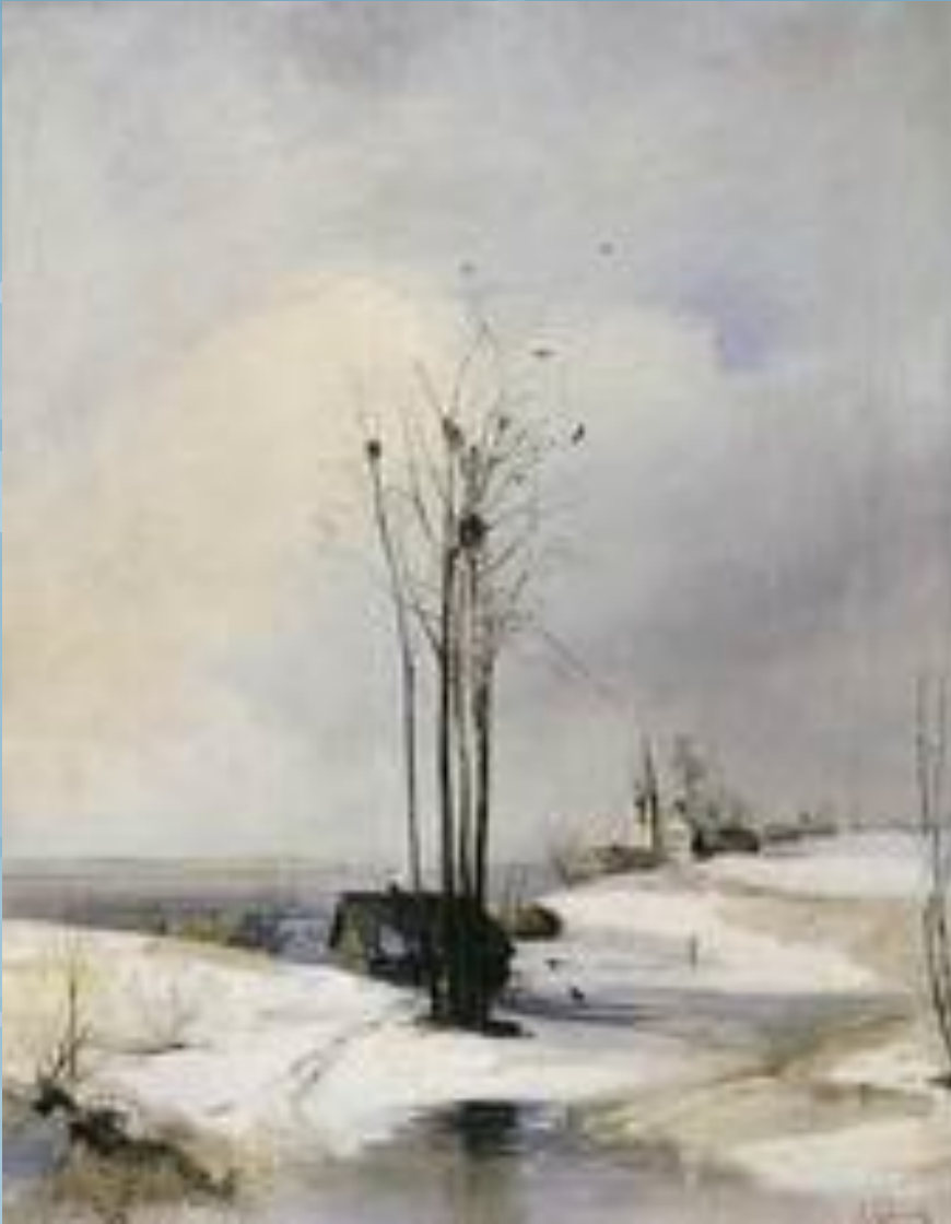
Ранняя весна. Оттепель. 1880-е гг.

То мороз, То лужи голубые, То метель, То солнечные дни. На пригорках Пятна снеговые Прячутся от солнышка В тени. Над землёй- Гусиная цепочка, На земле — Проснулся ручеёк, И зиме показывает Почка Озорной, зелёный Язычок.