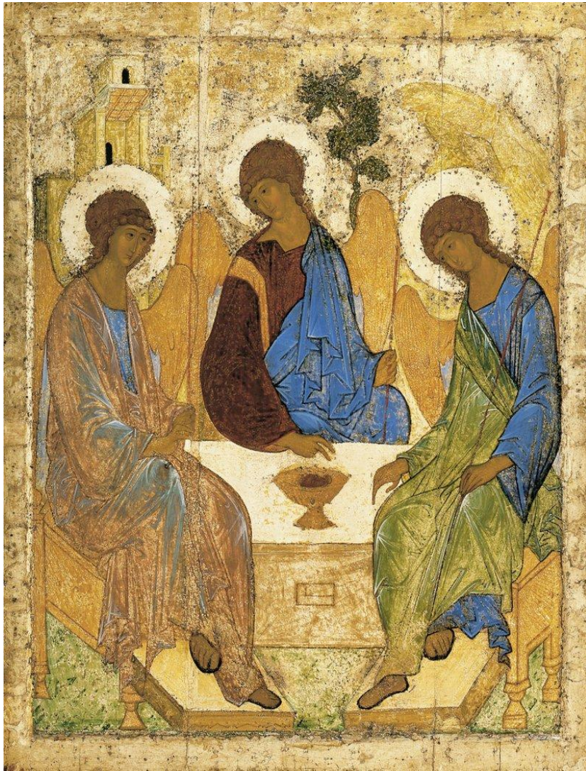
«Троица» Андрей Рублев

Глубоко символично и цветовое решение иконы. Лазурь среднего ангела передавала цвет божественного ума, чистота ума совершенного человека. Лиловый тон плаща левого ангела воспринимался как цвет умственного созерцания на высших его ступенях. Нежно-зеленый тон гиматия правого ангела считался цветом согласия и одновременно цветом весны, символом Воскресения. Интенсивным желтым цветом крыльев выражалась «надмирная» интеллектуальная сила. Наконец, золотой фон, почти полностью утраченный, символизировал «божественный свет».