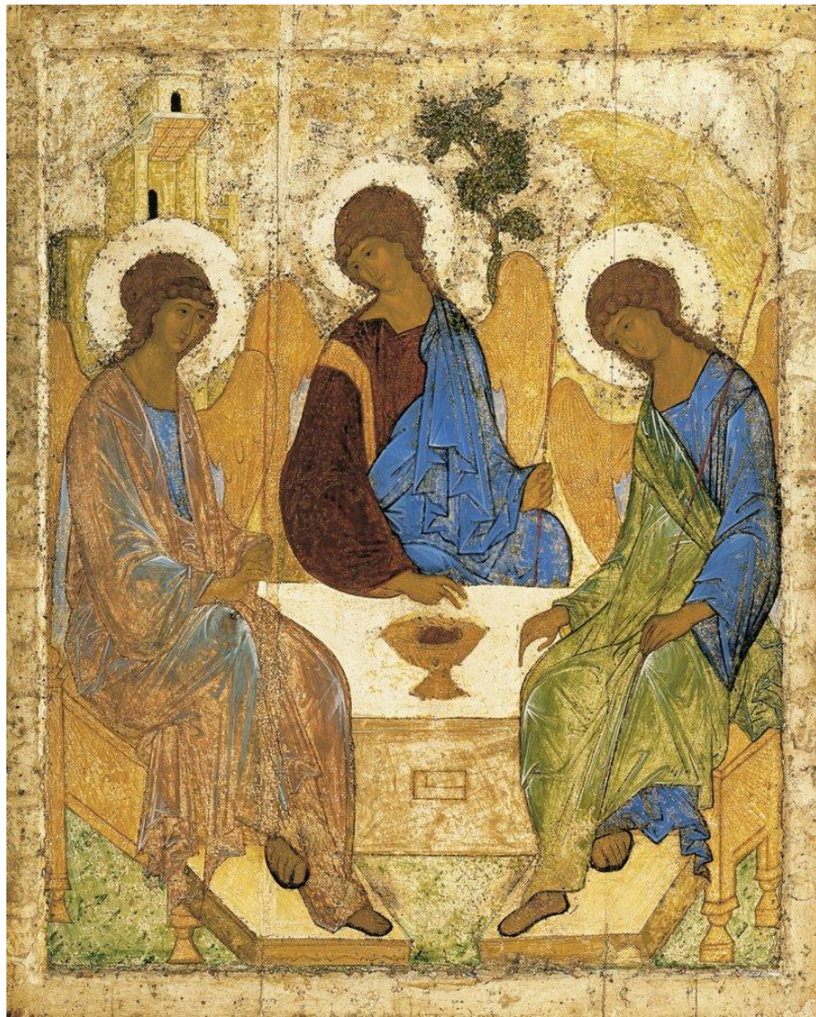
«Троица» Андрей Рублев

В иконе Рублева поражает необыкновенная простота, «немногословность», отброшены все бытовые подробности библейского повествования. Из ветхозаветного рассказа художник выбрал лишь те детали, которые дают представление, где и как происходило действие: гора (символ пустыни), палаты Авраама и Мамврийский дуб. Из искусства иллюстрирующего иконопись превратилась в искусство познающее.