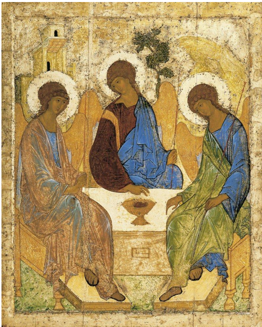
«Троица» А. Рублева.