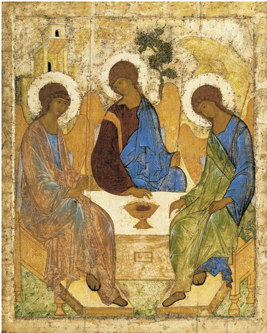
«Троица» Андрей Рублев

Дуб, палаты и гора превращаются в эмблемы, обозначающие вечность бога-отца, вдохновение бога-сына, возвышенную самоотверженность духа-утешителя. Гениальность Рублева - художника проявилась в том, что сложное глубокое философское содержание «Троицы» органически раскрыто средствами живописи - языком пластики, ритма, цвета.