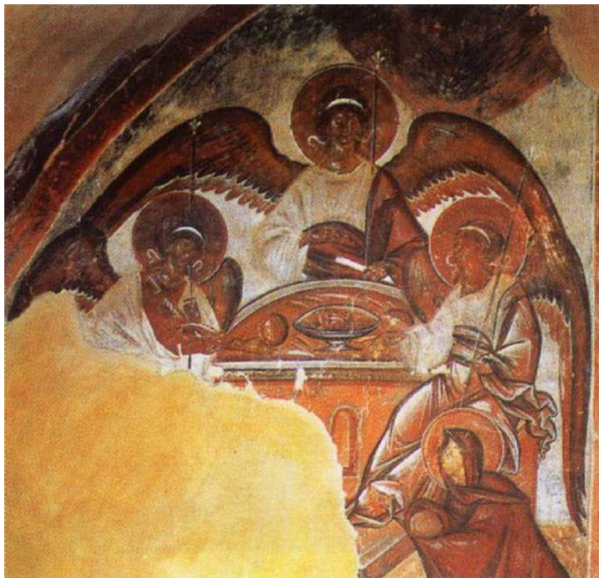
«Троица» Феофан Грек

1. Иконопись появилась на Руси в X в., после того как в 988 году, Русь приняла от Византии новую религию - христианство. Возникает интерес к драматическим сюжетам, пробуждается интерес к внутреннему миру человека. Новгород стал местом деятельности одного из самых мятежных художников средневековья - византийца Феофана Грека. Каждый персонаж Феофана - незабываемый человеческий образ.