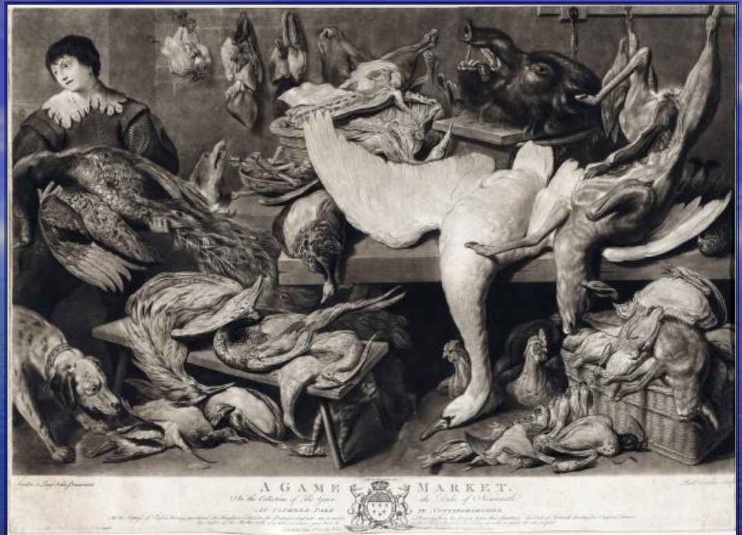
Ричард Ирлом. Серия Рынок. Дичь.

Он первый стал применять работу иглой к гравированию в технике меццо-тинто, в результате чего достиг в своих эстампах небывалых до того времени силы и отчётливости.