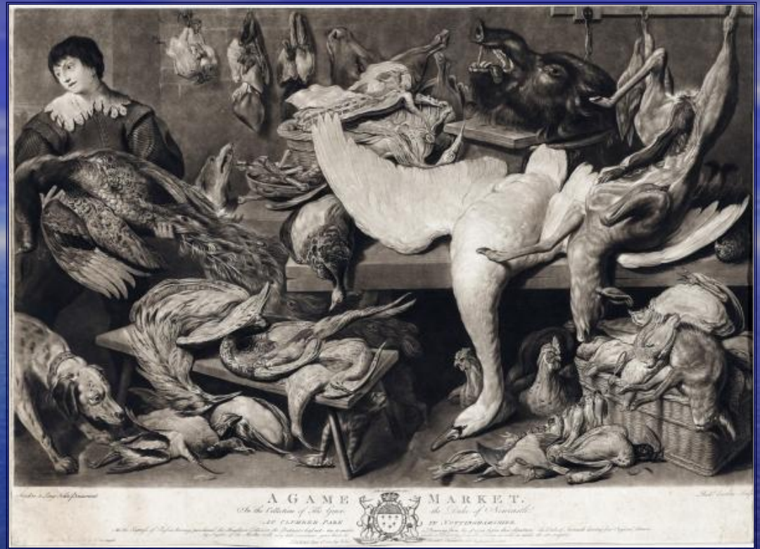
Ричард Ирлом. Серия Рынок. Дичь.