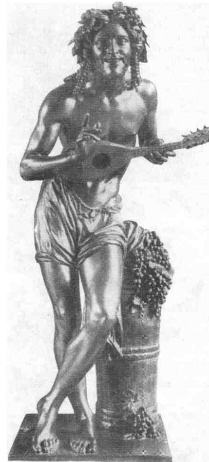
Франсуа Доре. Вакх с виной. 1839 г. обучения.