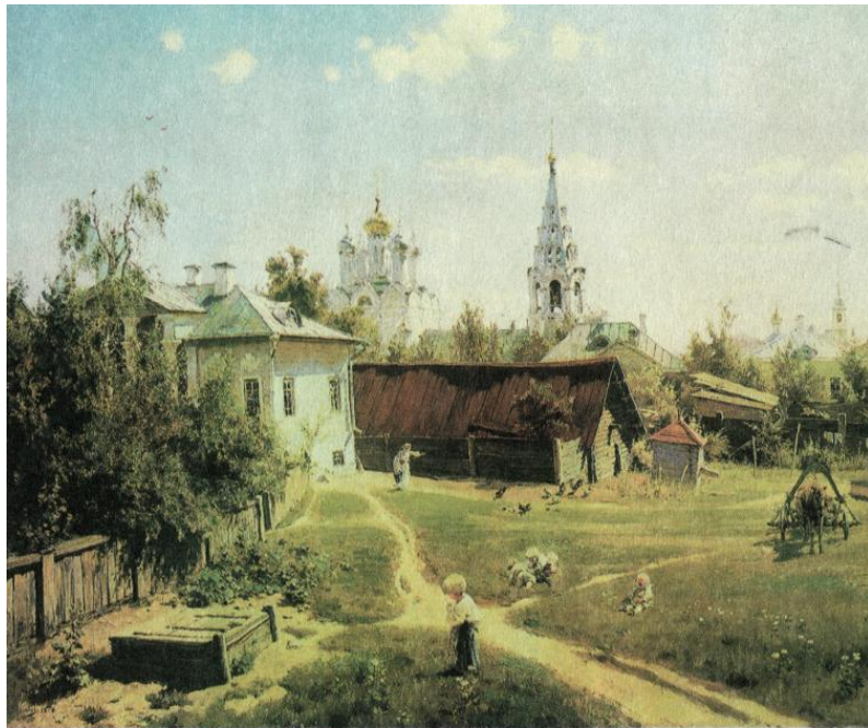
В. Д. Polenov. «Московский дворик». 1878 г. Масло