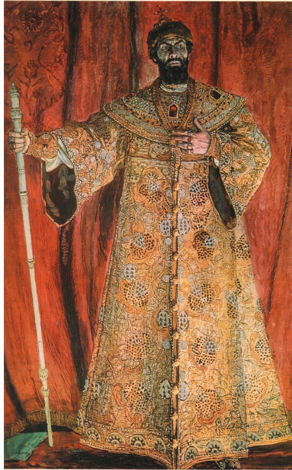
А. Я. Головин. Портрет Ф. И. Шаляпина в роли Бориса Годунова (опера «Борис Годунов» М. П. Мусоргского). 1912 г.