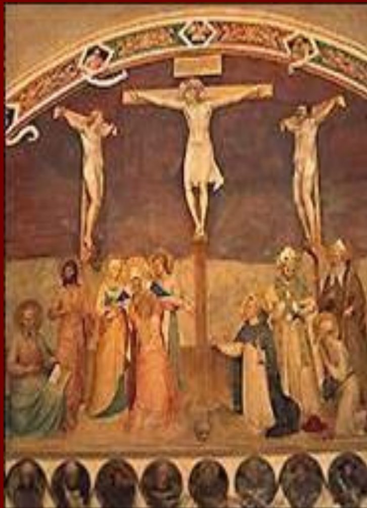
Фреска монастыря Сан – Марко.