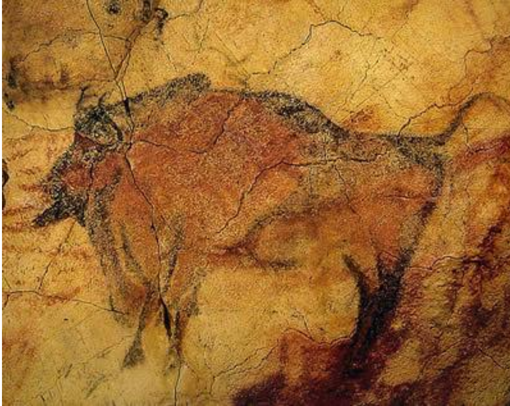
«Сиктинская капелла» палеолита Пещера Ласко. Франция.

Первоначально возникло картинное письмо — пиктограммы. Информация таким письмом передавалась буквально. Сюжеты и сегодня понятны. В качестве материалов использовали уголь, глину, псчим материалом служили своды пещер.