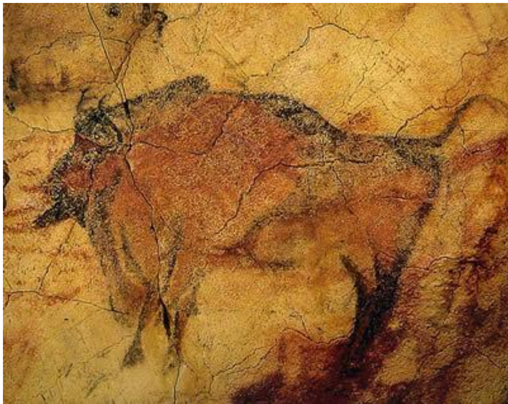
«Сиктинская капелла» палеолита Пещера Ласко. Франция.

Первоначально возникло картинное письмо — пиктограммы. Информация таким письмом передавалась буквально. Сюжеты и сегодня понятны. В качестве материалов использовали уголь, глину, псчим материалом служили своды пещер.