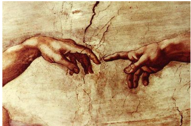
Сикстинская капелла. Ватикан. Фреска (1508 - 1512).