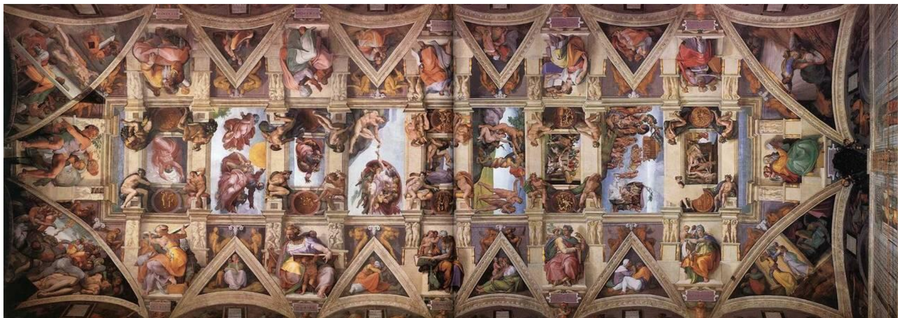
Сикстинская капелла. Ватикан. Фреска (1508 - 1512)