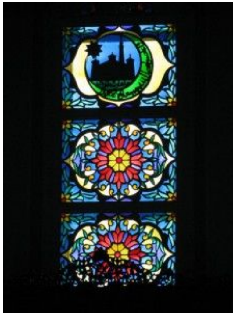
Витраж в мечети трёх сподвижников