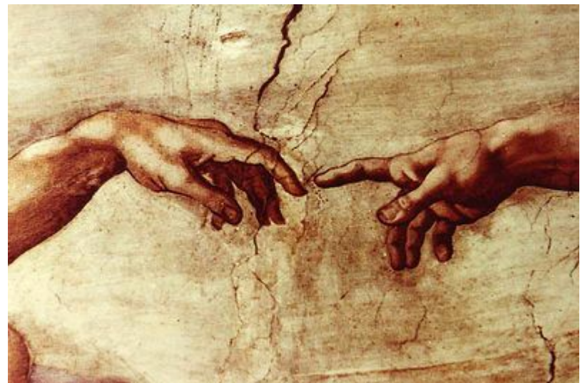
Сикстинская капелла. Ватикан. Фреска (1508 - 1512).