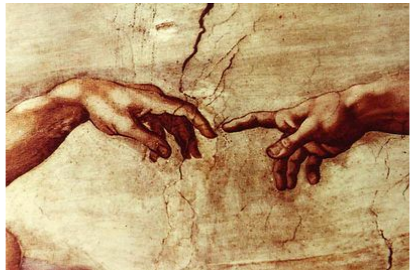
Сикстинская капелла. Ватикан. Фреска (1508 - 1512).