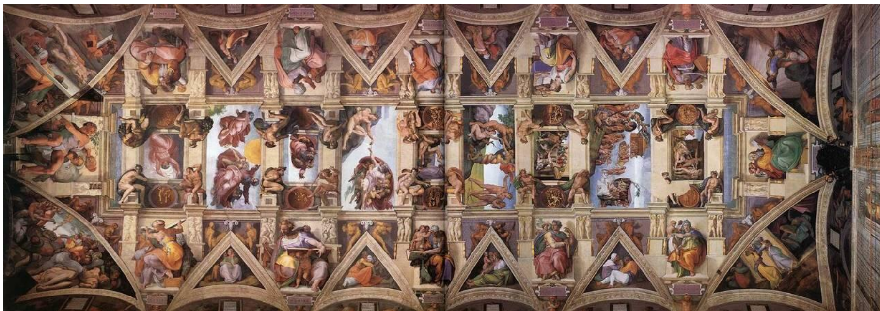
Сикстинская капелла. Ватикан. Фреска (1508 - 1512)