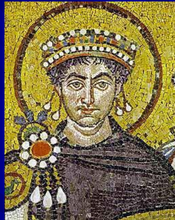
Justinian, detail of mosaic S. Vitale, Ravenna