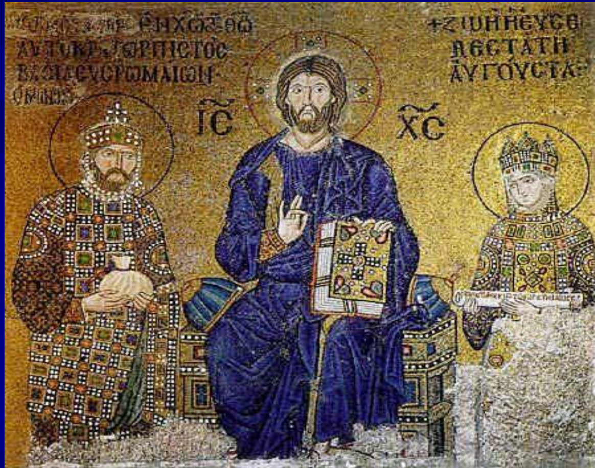
Приношение даров императором Константином IX Мономахом и императрицей Зоей