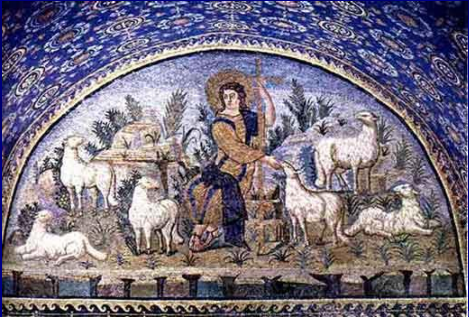
Добрый пастырь. Мавзолей Галлы Плацидии. Равенна