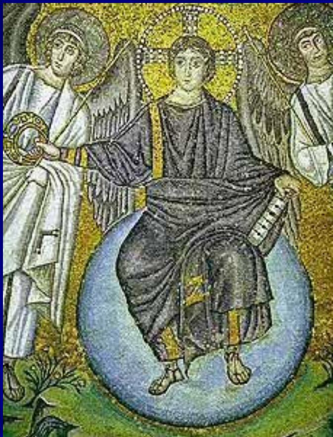
S. Vitale, Ravenna Apse mosaic Detail