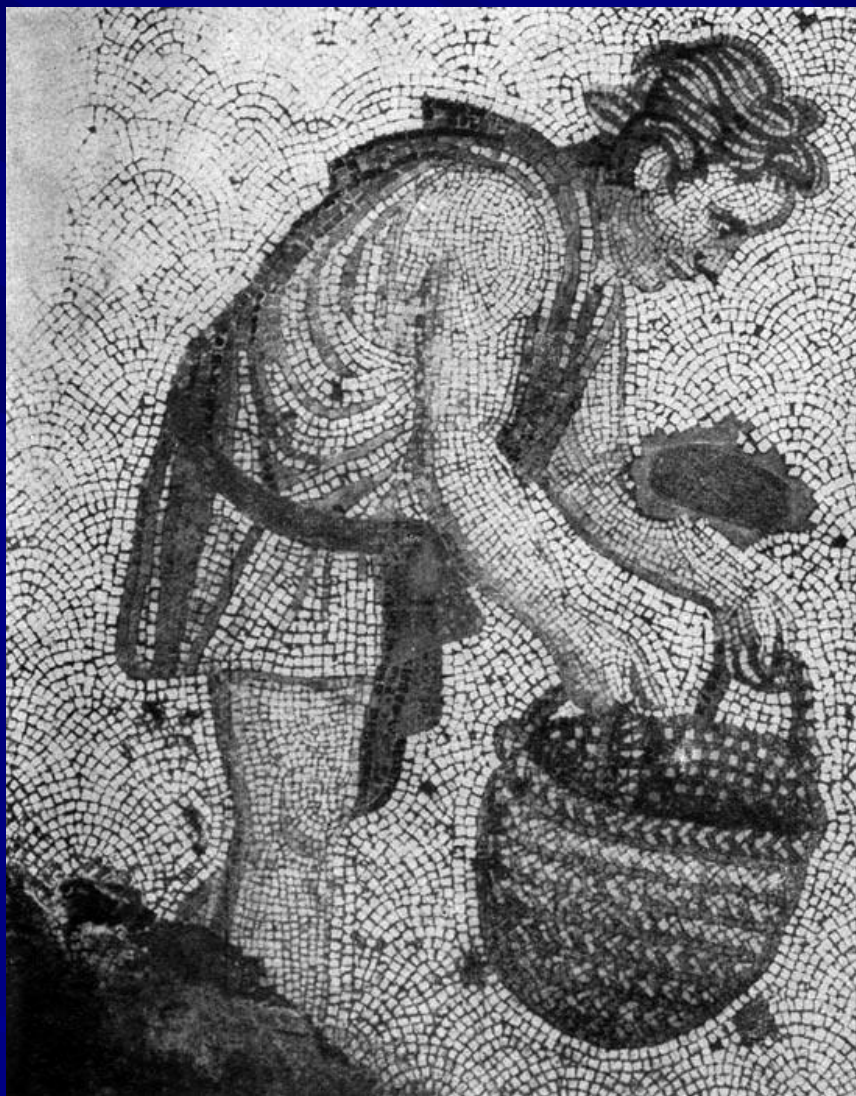
Фрагмент мозаичного пола Большого дворца императоров в Константинополе. 5 в.