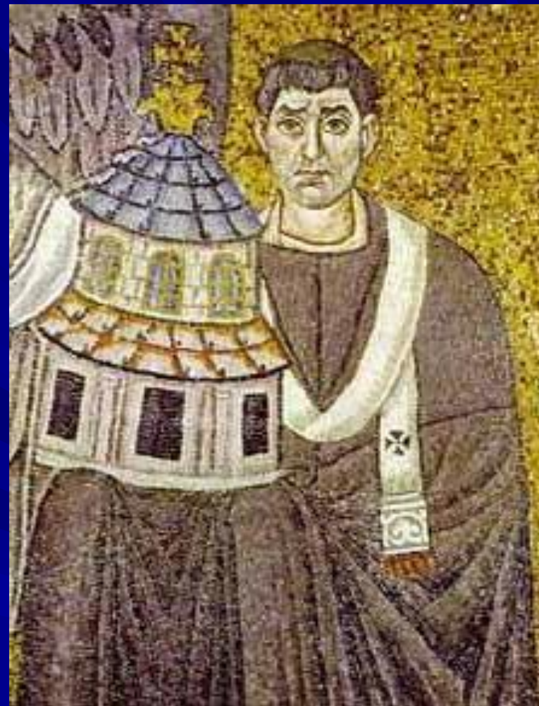
S. Vitale, Ravenna Apse mosaic Detail