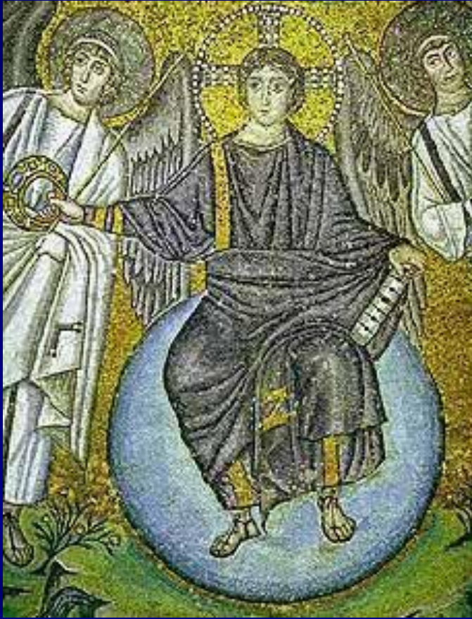
S. Vitale, Ravenna Apse mosaic Detail