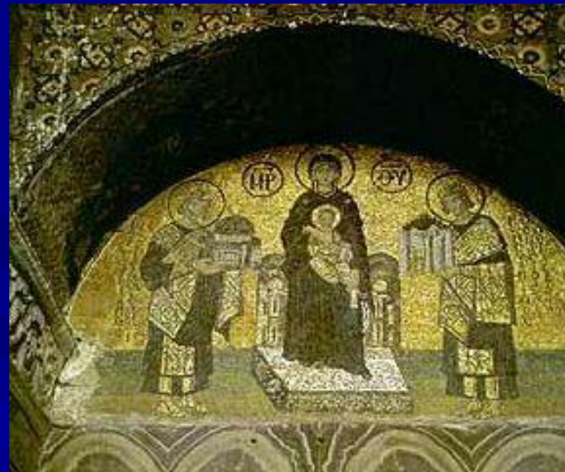
Приношение даров Константином и Юстинианом Мозаика в южном вестибюле Святой Софии Константинополь 11 век