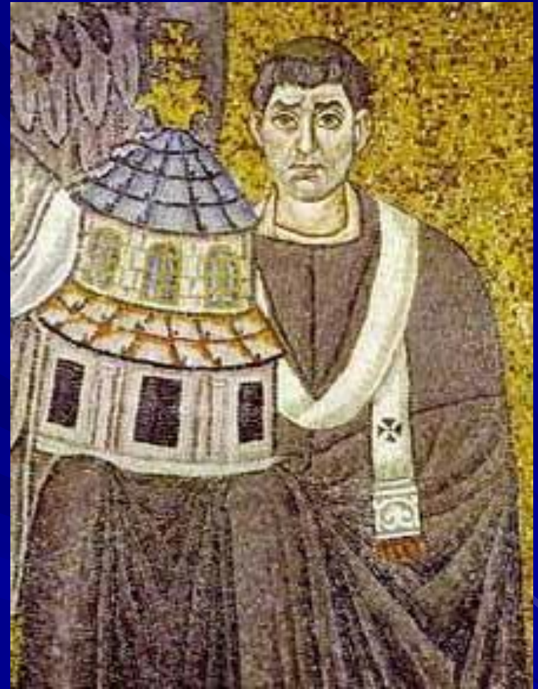
S. Vitale, Ravenna Apse mosaic Detail