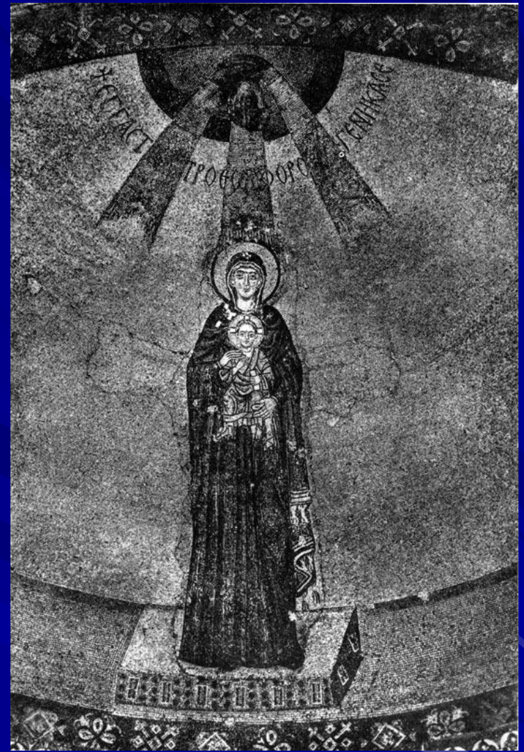
Богоматерь с младенцем. Мозаика абсиды церкви Успения в Никее. Вскоре после 787 г.