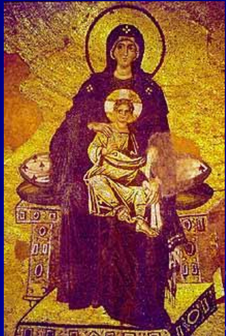
Богоматерь с младенцем. Мозаика. Собор Св.Софии в Константинополе