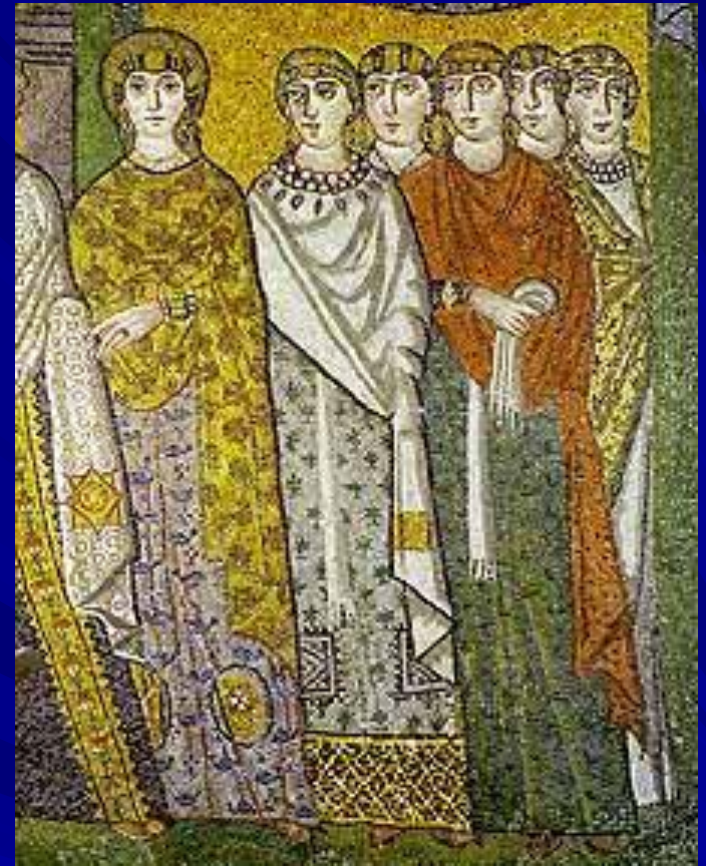
Theodora with courtiers Detail S. Vitale, Ravenna