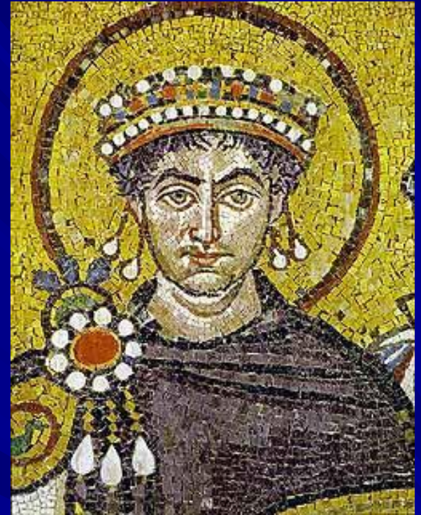
Justinian, detail of mosaic S. Vitale, Ravenna