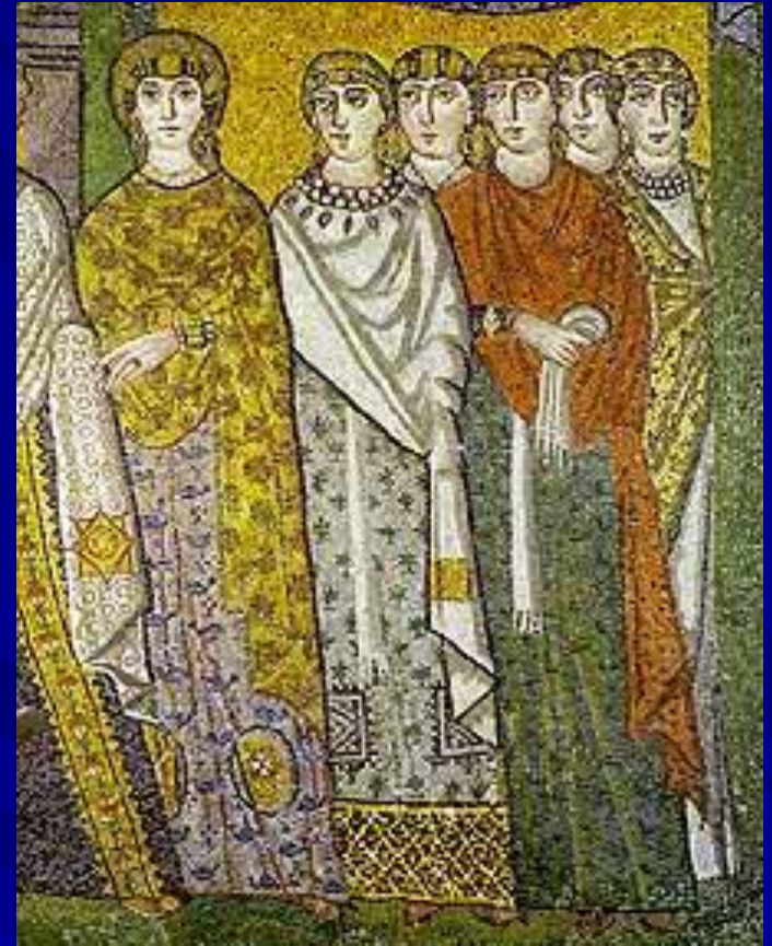
Theodora with courtiers Detail S. Vitale, Ravenna